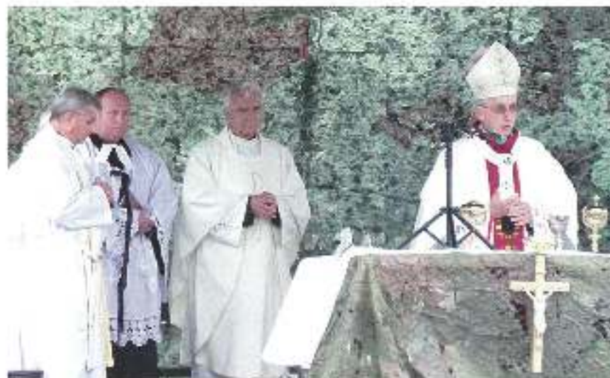
Mszy polowej przewodniczył abp. Metropolita Katowicki Wiktor Skwarc