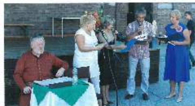
Radni Gminy Wyrzy przyłączyli się do czytania