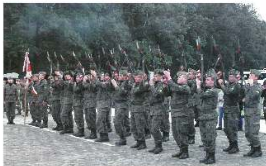
Żołnierze oddziału pod pomnikiem śląskiej brzozy