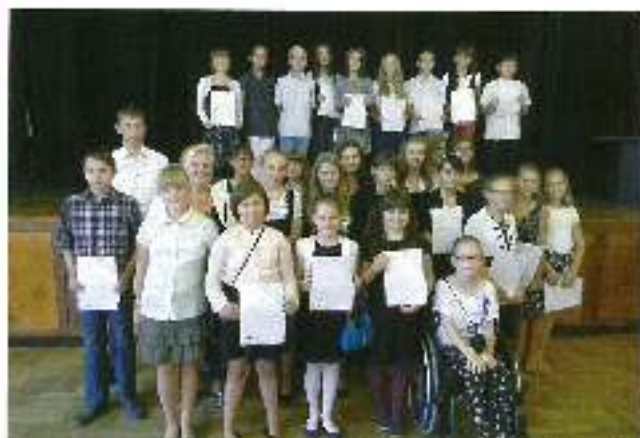
Uczniowie wsi i osiedlowych