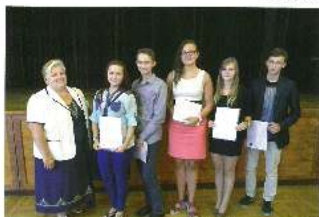
uczniowie szkół ponadgimnazjalnych