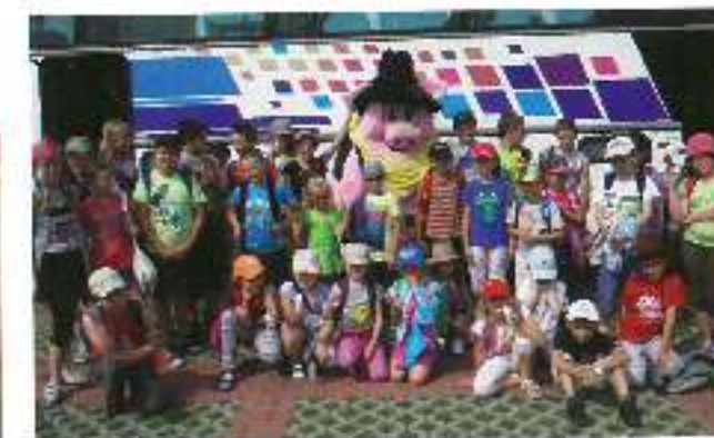
Od 8 do 26 lipca w Domku Kultury w Gostyni zaprezentował Klub Jędrzej. Przez ten czas w wieku 40 osób deszcz się wokalny i instrumentalny zespół wykonywał od siebie wokal. Część 13.