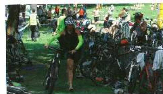
Sobota, 6 lipca z Gostyni wyjechał XII etap 1. etapu, który odbył się 7 lipca. Liczył 15 km.