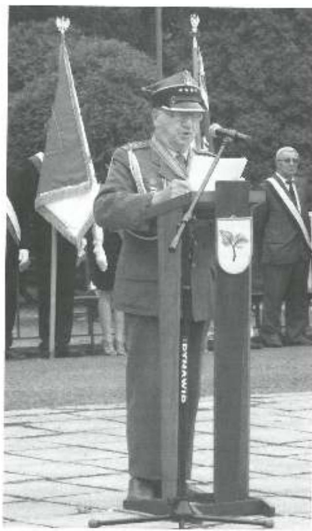
Przewodniczącą uroczystości w Gostyni p. Imię i nazwisko nieznane

Wójt Gminy Wiry Rada Społeczna Gminy Wiry