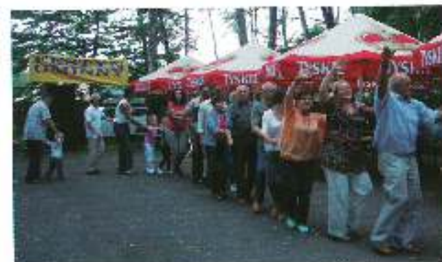
W hali na Ośrodku Sportowym im. Józefa Góraczyka w Wyrach odbył się Festyn Gminy. Do zabawy zaprosili mieszkańcy Dobrej Nawyki z zespołem Akcentis.