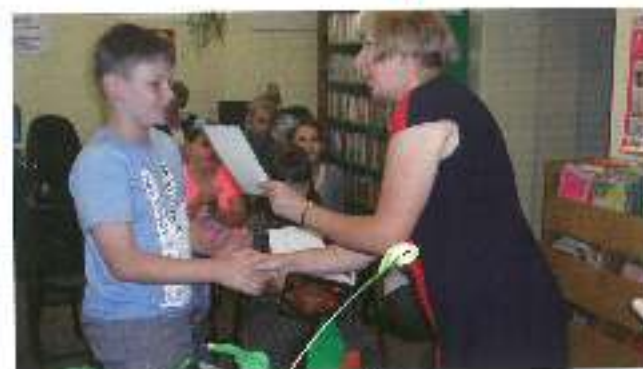
W zespole w wieku oblatem odbył się podsumowanie konkursu cyfrowego dla uczniów szkół podstawowych i gimnazjów.