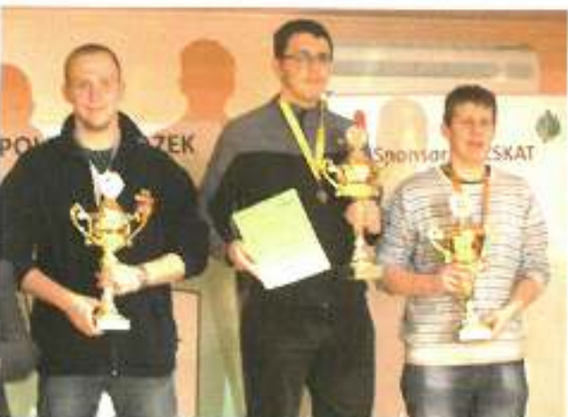
(Mistrz Olea czył w szkole)