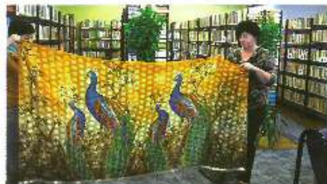
24 kwietnia w bibliotece w Gostyni odbył się spotkanie promujące projekt „Książka dla każdego”. Tematem spotkania były dzieci. Uczestnicy spotkania obejrzały przebieg multimedialny i wysłuchali odczytu z wykładu dr. Ingrid. Szlachetny i jego j. Ingrid ma być organizacją wdrażającą dobre zarządki.