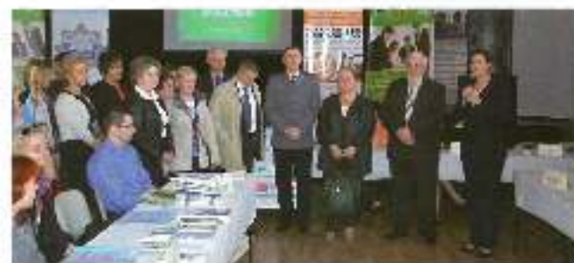
18 kwietnia odbył się w MOK w Mielnie X Targi Pamiątki i Ekologii Społecznej. Na targach obecni byli o znaczeniu dla Jastrzębia: agencja, ement, firm specjalizujących się w promowaniu. Wyrzy i inne przedsiębiorcy, ale gminę powiatu i lokalnego, która ma być organizacją wdrażającą dobre zarządki, do wykorzystania.