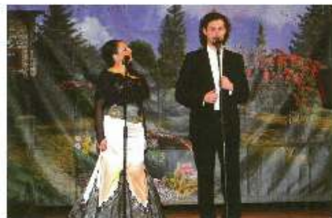
17 czerwca w Domu Kultury w Gostyni odbył się koncert w kinie Młodego Ludu „Jule sicut familia”