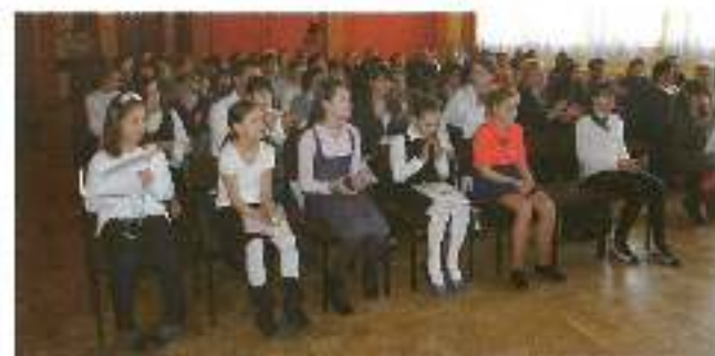
10 kwietnia w Domu Kultury w Gostyni odbyło się uroczyste wzięcie 43 świątecznych życzeń od mieszkańców gminy Wyrzy.