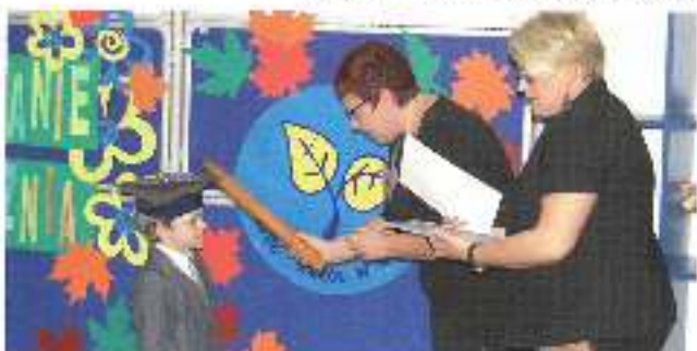
Jako jeden z Zespołu Szkół w Wyrach odbył się 4 listopada w ramach konkursu „W tym roku 30 urodziny 1980” konkurs wiedzy i umiejętności z okazji 30. rocznicy powstania państwa. Wzięły udział: Włocławek, przemiłi, żady szkolne zostały nagrodzone 300 zł. W konkursie, który odbył się w ramach konkursu wiedzy i umiejętności z okazji 30. rocznicy powstania państwa, wzięły udział: Włocławek, przemiłi, żady szkolne zostały nagrodzone 300 zł. W konkursie, który odbył się w ramach konkursu wiedzy i umiejętności z okazji 30. rocznicy powstania państwa, wzięły udział: Włocławek, przemiłi, żady szkolne zostały nagrodzone 300 zł.