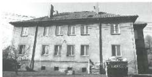
Nowy budynek biblioteki przy ul. ks. F. Bojda 2

W październiku trwał remont nawierzchni chodnika przy ulicy Dąbrowszczaaków w Wyrach (strony północnej). Remont na zlecenie Powiatowego Zarządu Dróg w Łaziskach Górnych wykonywany był przez Przedsiębiorstwo Usługowo – Handlowe „Maja” z Katowic.