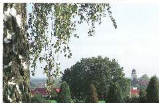
Fot. Blanka Goleczka - pierwsze wyróżnienie