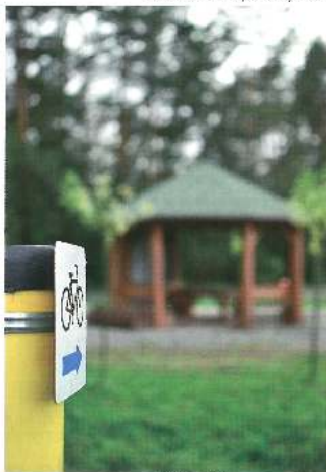
drugie wyróżnienie