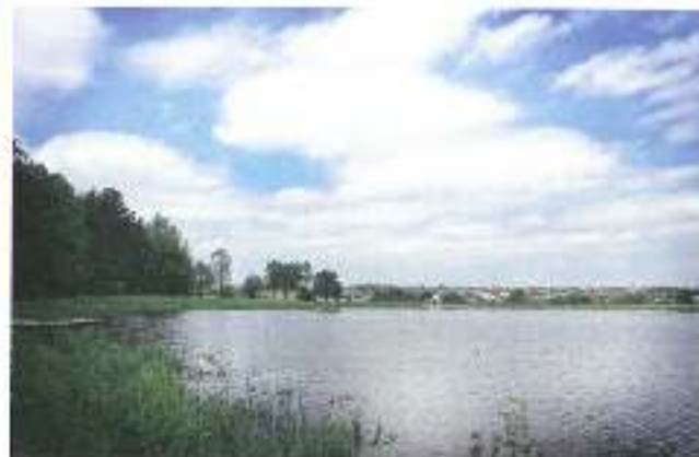
Łąki nad Jeziorem