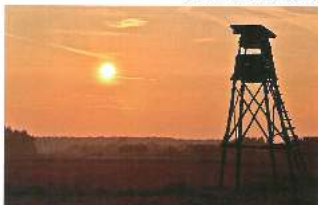
trzeci wyróżnienie