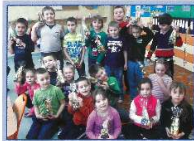
27 marca dzieci z grupy Igryskówek Przedszkola w Żesiole Szkoła w Gostyni czekały na Zajączka. W oczekiwaniu na niespodzianki wykonywały różne zadania, bawiły się w "rodzinki", szukały pisanki i po wygotowaniu wszystkich żółtych czekala na nich niespodzianka od Zajączka i czekoladowe słodkości. Małgorzata Rajnoga