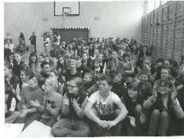
Wiosni kibice nie szczepili łez