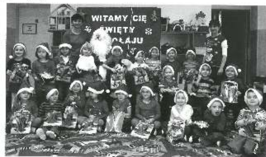
Św. Mikołaj w grupie Miśków