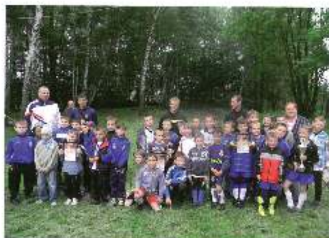
Kategoria Młodziak Młodszy

Wójt Gminy Wiry Rada Sportu Gminy Wiry Tekst i fot. Zofia Syta