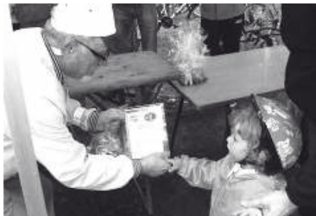
Wręczono również nagrodę dla Najmłodszego Uczestnika Rajdu