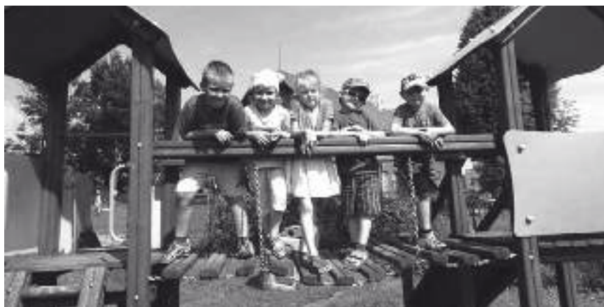
Doposażone zostały place zabaw. Na zdjęciu dzieci z GP w Wyrach na zakupionym w ramach projektu zestawie zabawowym.