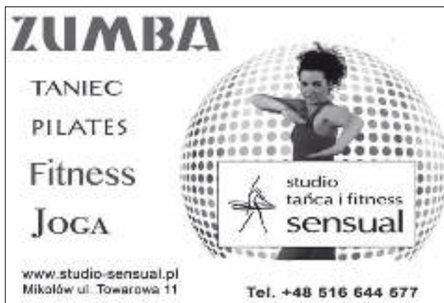
Studio Tańca i Fitness „SENSUAL” w Mikołowie jest sponsorem naszej krzyżówki.

Hasło krzyżówki nr 76 brzmiało „Przeciwności losu uczą mądrości, powodzenie ją odbiera.”