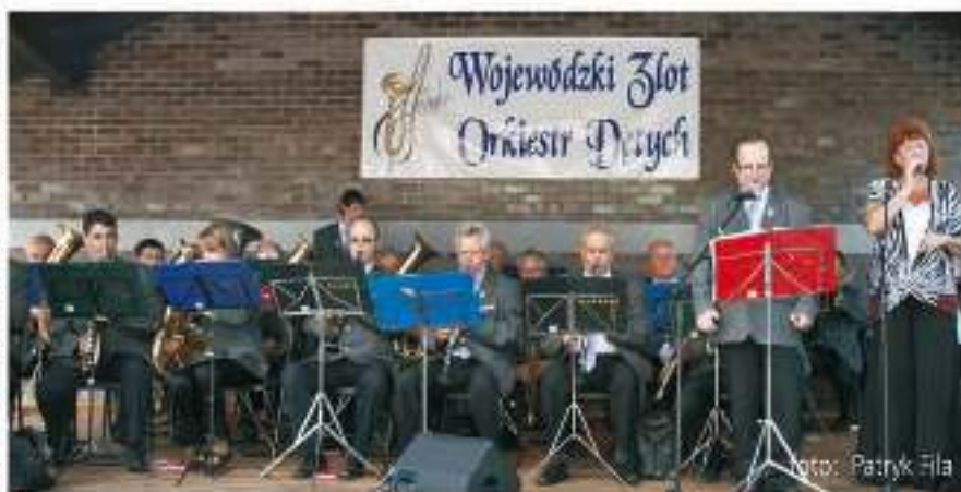
autor: Patryk Fila

W wyjątkowo słoneczne niedzielne popołudnie, 16 września, na Zagrodzie Śląskiej w Gostyni odbył się I Wojewódzki Złot Orkiestr Dętych „Ambitus”. To niecodzienne wydarzenie, w skali ogólnopolskiej wciąż zaniebywane, rozpoczęła Msza Św. w Kościele Parafialnym p.w. Apostołów Piotra i Pawła w Gostyni, po której nastąpił uroczysty przemarsz orkiestr na teren Zagrody. Przed liczną zgromadzoną publicznością zaprezentowała się: Orkiestra Dęta Elektrowni „Łaziska”, Orkiestra Reprezentacyjna Policji Województwa Śląskiego, Miejska Orkiestra Dęta „Cieszyńianka”, Tarnogórska Orkiestra Dęta, Orkiestra OSP Tapkowice, Młodzieżowa Orkiestra Dęta z Kóz, Orkiestra Dęta Gminy Krzyżanowice oraz Orkiestra Dęta KWK „Bolesław Śmiały”. Ze sceny popłynęły dźwięki doskonale znanych standardów m.in. jazzowych, czy muzyki popularnej w skocznych, orkiestrowych aranżacjach.