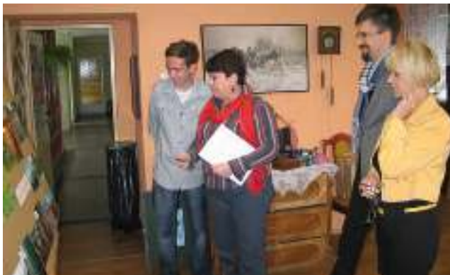
Jury podczas obrad

Otwarcie wystawy pokonkursowej oraz wręczenie nagród odbędzie się 10 października br. o godz. 17. 30 w sali lustrzanej (dawne Rancho). Serdecznie zapraszamy uczestników konkursu wraz z osobami towarzyszącymi, jurorów, sponsorów oraz wszystkich zainteresowanych.