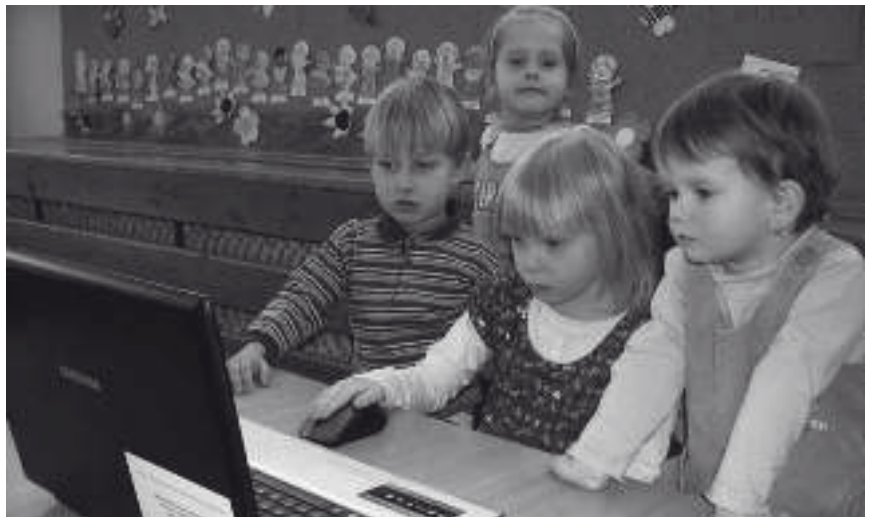
Uczestnicy projektu z Gminnego Przedszkola w Gostyni podczas zajęć komputerowych.

37 dzieci; w roku szkolnym 2011/2012 – 24 dzieci z Gminnego Przedszkola w Gostyni + 7 dzieci z Gminnego Przedszkola w Wyrach, które ukończyły terapię z efektem całkowitej poprawy wymowy oraz 30 uczestników projektu z GP w Gostyni i 30 uczestników projektu z GP w Wyrach, którzy usprawnili wymowę, wzbogacili słownictwo jednakże zalecana jest dalsza terapia. Ogółem terapia zakończyła się sukcesem dla 128 uczestników projektu, z czego całkowitą poprawę odnotowano u 68 uczestników projektu tj. 125,93% z zaplanowanej liczby dzieci.