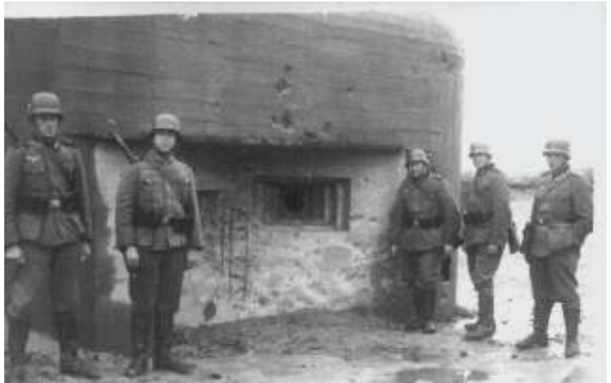
Żołnierze niemieccy pod schronem (jesień 1939 r.)

Ta działalność jest bardzo prosta i zarazem trudna. Żeby utrzymywać w dobrym stanie i wyposażać schron trzeba zainwestować wolny czas i pieniądze. To oznacza, że zamiast poświęcić czas własnej rodzinie, trzeba jechać otworzyć schron,