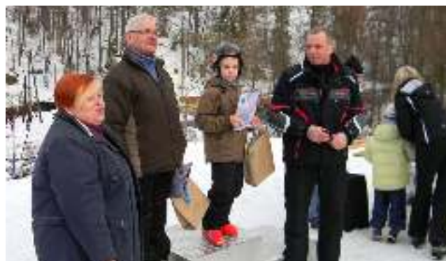
Najmłodsi i najstarszy zawodnik.