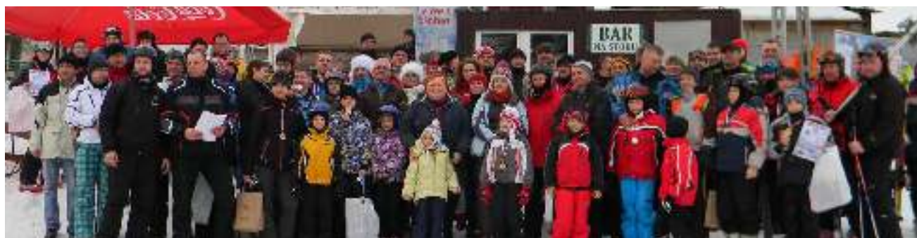
Uczestnicy III Mistrzostw Gminy Wyry w Narciarstwie Alpejskim.