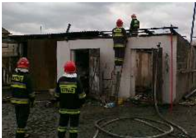
25 lutego strażacy gasili pożar budynku gospodarczego na ul. Zbożowej w Wyrach.