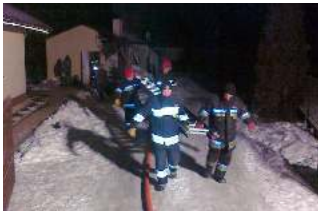
1 lutego strażacy gasili pożar budynku gospodarczego na ul. Leszczynowej w Wyrach.