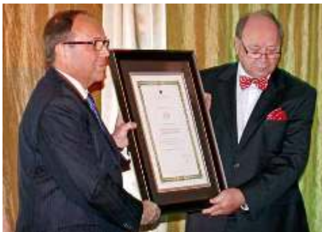
Bank Spółdzielczy w Jastrzębiu Zdroju otrzymał Statuetkę za Zasługi dla Zrzeszenia BPS oraz Złoty Medal im. Franciszka Stefczyka za zasługi dla Spółdzielczości Bankowej.

To wyjątkowe święto było powodem zorganizowania Tuczystego Zebrania Przedstawicieli Banku Spółdzielczego w Jastrzębiu Zdroju oraz Wieczoru Jubileuszowego, który odbył się w piątek 20 kwietnia.