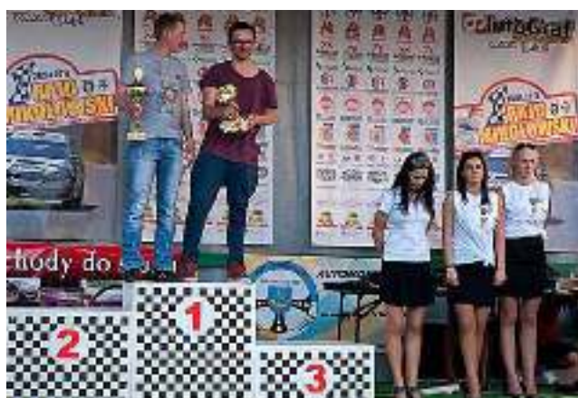
Najlepsi na odcinku specjalnym „Gostyr”