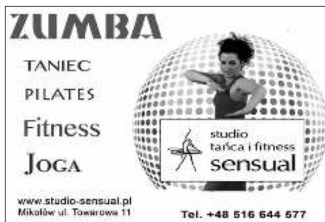
Studio Tańca i Fitness „SENSUAL” w Mikołowie jest sponsorem naszej krzyżówki.

Więcej informacji oraz dokumenty rekrutacyjne można pobrać na stronie internetowej: www.nowystart.izba.tychy.pl