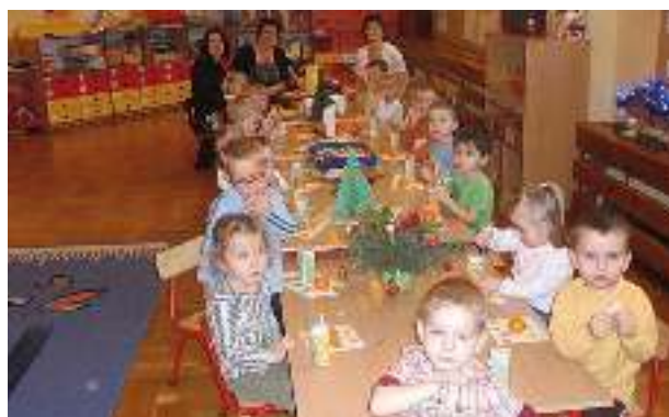
Grupowa wigilia w Krasnalkach.