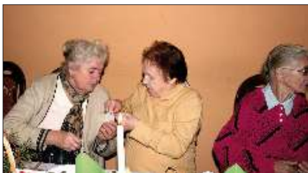
20 grudnia po raz kolejny do wigilijnego stołu swoich podopiecznych zaprosił Gminny Ośrodek Pomocy Społecznej w Wyrach.