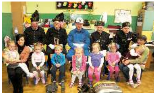
Grupa trzylatków - Rybki z górnikiem.