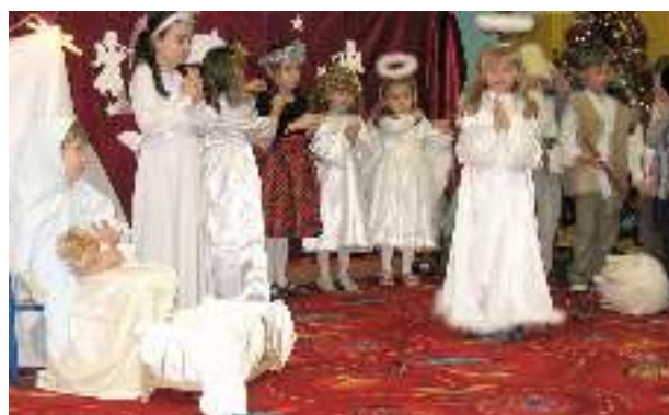
Jasełka w grupie sześciolatek - Wiewiórki.