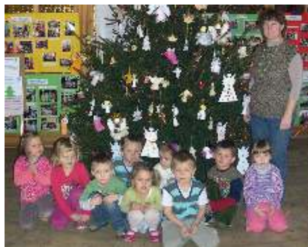
Biedronki pod anielską choinką.