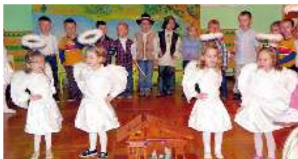
Wigilijny wieczór w grupie Biedronek.