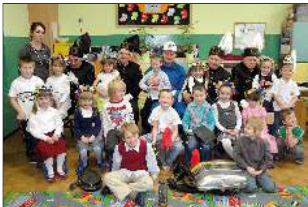
Grupa 6-latków - Wiewiórki z Gminnego Przedszkola w Wyrach podczas grudniowego spotkania z górnikiem.