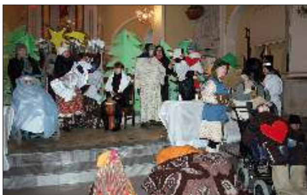
17 grudnia w wyrskim kościele odbyły się jasełka przygotowane przez Ośrodek Rehabilitacyjno-Edukacyjno-Wychowawczy w Wyrach.

uczycieli Zespołu Szkół w Wyrach; młodzieży i grona pedagogicznego Zespołu Szkół w Gostyni; od wychowanków i pracowników OREW w Wyrach, dyrektora i pracowników Domu Kultury w Gostyni, fundacji „Iskierka”.