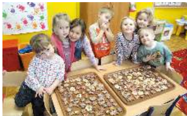
Czterolatki dekorują pierniki.