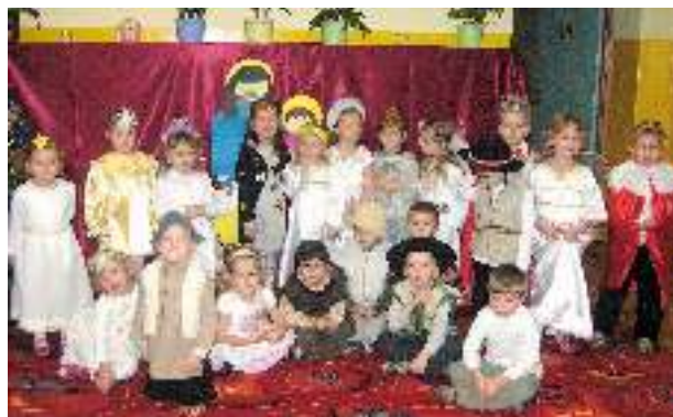
Jasełka w grupie czterolatek – Misie.