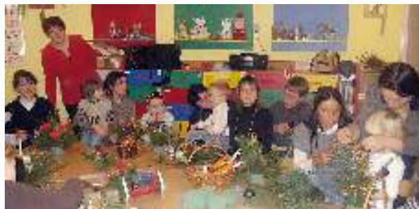
Grupa Krasnalków robi z rodzicami stroiki.