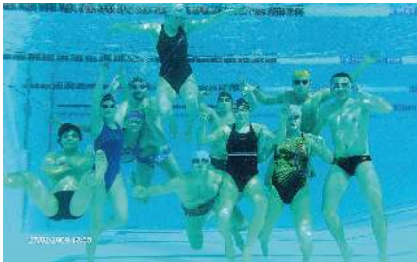
Grupa podczas zajęć ze studium trenerskiego.