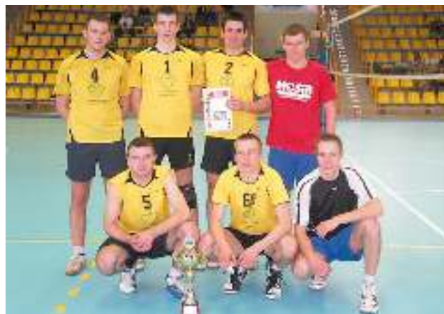
Drużyna Ogień Gostyń.

Godz. 14.00 Finał — zwycięzcy meczów C i D Ogień Gostyń — No Pain 2:3