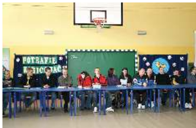
Zespół Szkół w Wyrach

międzyludzkich. Jednym z założeń jest to, aby osoby niepełnosprawne pokazały i przedstawiły młodzieży gimnazjalnej swój punkt widzenia na temat nie tylko kulturalnego dopingiu, ale również stereotypów dotyczących niepełnosprawności i sportu.