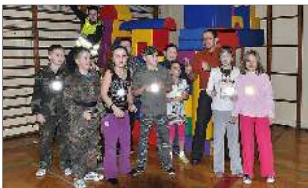
Z 14 na 15 stycznia uczniowie Zespołu Szkół w Gostyni z klas I-III, wzięli udział w „Nocnym spotkaniu z bajką i baśnią”.