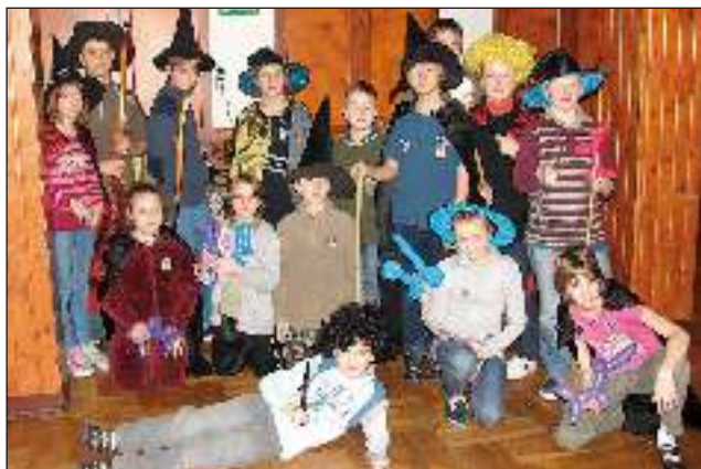
Część uczestników podczas ferii zimowych zorganizowanych przez Dom Kultury w Gostyni.