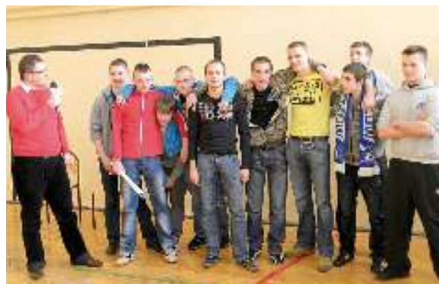
Zespół Szkół w Gostyni