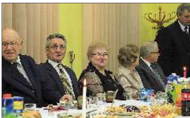
15 stycznia członkowie chóru Zorza zorganizowali w budynku pawilonu handlowego spotkanie oplatkowe.