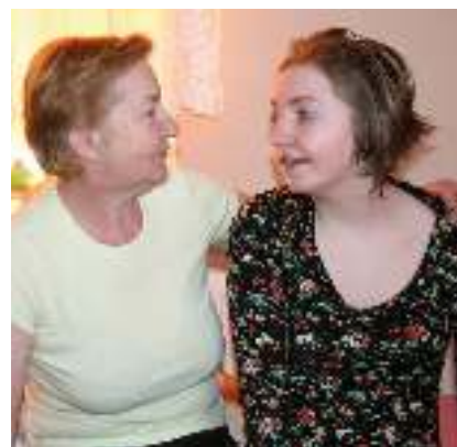
Agata z mamą.

- Nie potrafię wymienić wszystkich osób, które nam pomagają, ale przyznam, że jesteśmy szczęściarzami. Otaiczają nas fantastyczni ludzie, dla których