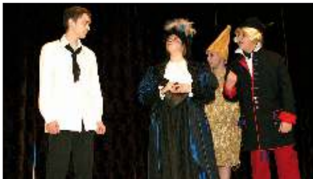
Grupa z Gimnazjum w Gostyni podczas IV edycji Wojewódzkiego Przeglądu Teatralnego - Gostyńskie Teatralki. Uroczysta gala odbędzie się 27 kwietnia w Domu Kultury w Gostyni.