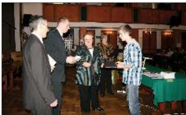
30 marca w Domu Kultury w Gostyni odbyło się wręczenie nagród i wyróżnień za wybitne osiągnięcia sportowe.