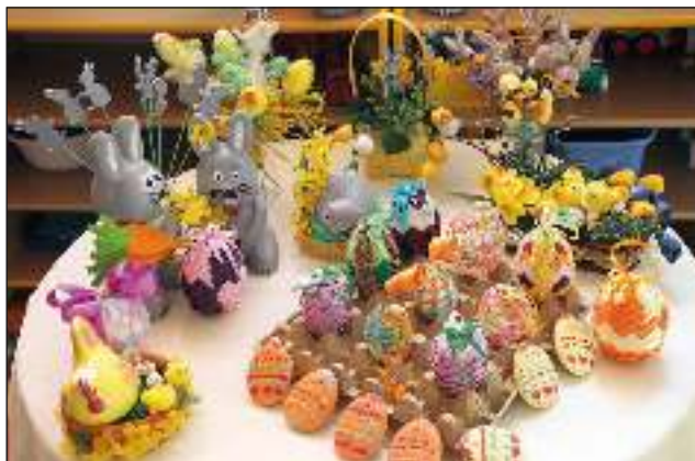
Świąteczne prace dzieci z Gminnego Przedszkola w Gostyni.