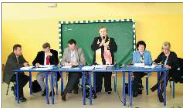
5 i 6 kwietnia w Wyrach i w Gostyni odbyło się spotkanie wójta i radnych z mieszkańcami.