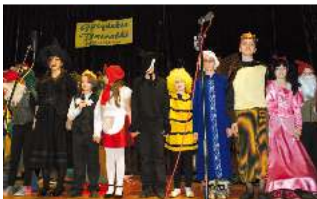
Aktorzy ze Szkoły Podstawowej w Gostyni.

Pogody ducha, zdrowia i radości oraz wszelkiego dobra z okazji Świąt Wielkanocnych