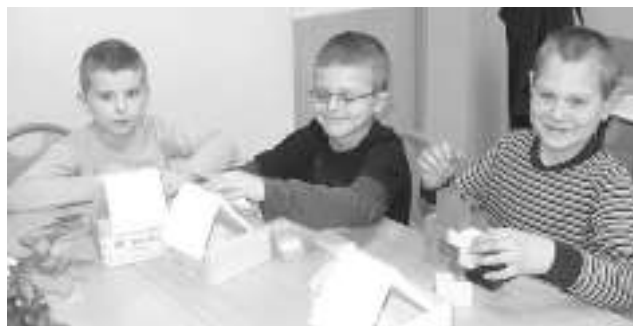
Zajęcia psychoedukacyjne w SP w Gostyni.

Realizacja zajęć zakończy się w czerwcu 2012 r., a sam projekt miesiąc później. Na lipiec zaplanowano już tylko rozliczenie projektu.