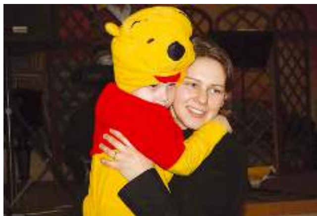
Kubuś Puchatek na balu w wyrskim przedszkolu.

Uśmiechu w każdej sekundzie, radości w każdej minucie, przyjaźni w każdej godzinie, szczęścia każdego dnia, miłości przez całe życie.