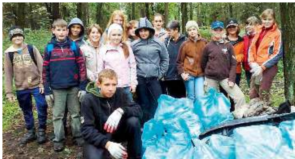
Akcja „Sprzątanie świata” z udziałem młodzieży.

Harmonogram bezpłatnej zbiórki posegregowanych odpadów typu plastik, szkło i papier – „u źródła”, czyli bezpośrednio od mieszkańców Wyr i Gostyni – przez firmy, z którymi mają podpisaną umowę na wywóz śmieci, dostępny jest na stronie www.wyrzy.pl w zakładce „Ochrona środowiska”.