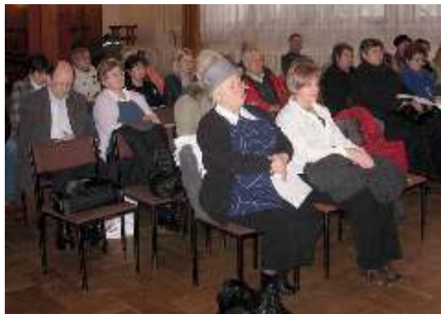
Spotkanie w ramach programu „Działaj lokalnie! Wyrę bliżej Europy” - czyt. str. 16.