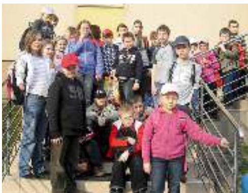
Uczniowie ZS w Wyrach przed basenem.

Ministerstwo Sportu i Turystyki na wniosek Gminy Wyrzy przyznało dofinansowanie w 2010 roku do zajęć ze środków Funduszu Zajęć Sportowo-Rekreacyjnych dla uczniów, w kwocie 30.000 zł, z wymaganym wkładem własnym gminy 30.000 zł.