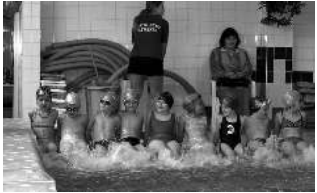
Wyjazd na basen przedszkolaków z Gostyni