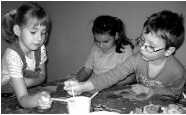
Warsztaty etnologiczne przedszkolaków z Wyr