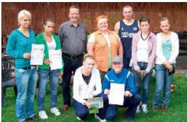
Trzy pierwsze pary wśród kobiet.

13 września na boiskach przy Domu Przyjęć Okolicznościowych „Gostyniec” odbył się III Turniej Piłki Siatkowej Plażowej o Puchar Wójta Gminy Wyrzy. W turnieju wzięło udział 16 par, w tym dziesięć męskich, cztery damskie i dwie mieszane. Do zawodów zgłosiło się łącznie 16