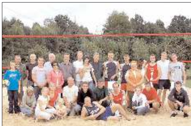
Zwycięcy w kat. mężczyzn oraz goście.

- Do turnieju zgłosiły się osoby, które w siatkówkę grają od niedawna, ale też gracze, którzy brali udział w Mistrzostwach Śląska czy Mistrzostwach Polski. Najmłodsza zawodniczka miała 13 lat, a najstarszy zawodnik