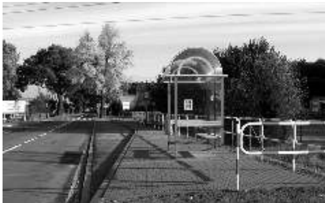
Nowa zatoka autobusowa w Gostyni ul. Pszczyńska w rejonie skrzyżowania z ul. Łuczników.

W latach 2008-2009 Gmina Wyry realizowała inwestycję pn. „Budowa zatok autobusowych w ciągu drogi wojewódzkiej nr 928 – ul. Pszczyńska w Gostyni w rejonie skrzyżowania z ul. Miarową i ul. Łuczników”. Wykonawcą robót była firma „Komplexbud – 2” z Rybnika, nadzorowana przez Urząd Gminy Wyry. W okresie od sierpnia do października 2008 roku powstały trzy zatoki z wiatami przystankowymi, natomiast od sierpnia do września 2009 r. jedna zatoka z wiatą. Wnioskodawcą powstania zatok przystankowych byli mieszkańcy ul. Łuczników w Gostyni.