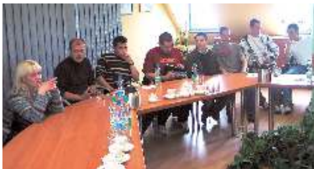
Na zdjęciu członkowie Rady Sportu oraz przedstawiciele „dzikich drużyn”