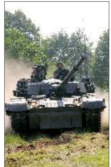
fol. A. Mikołajec