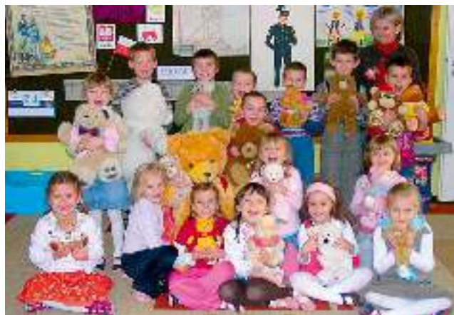
Dzień Pluszowego Misia w Przedszkolu w Gostyni - czyt. str. 4