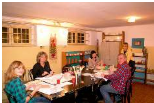
Warsztaty ceramiczne w Domu Kultury w Gostyni.