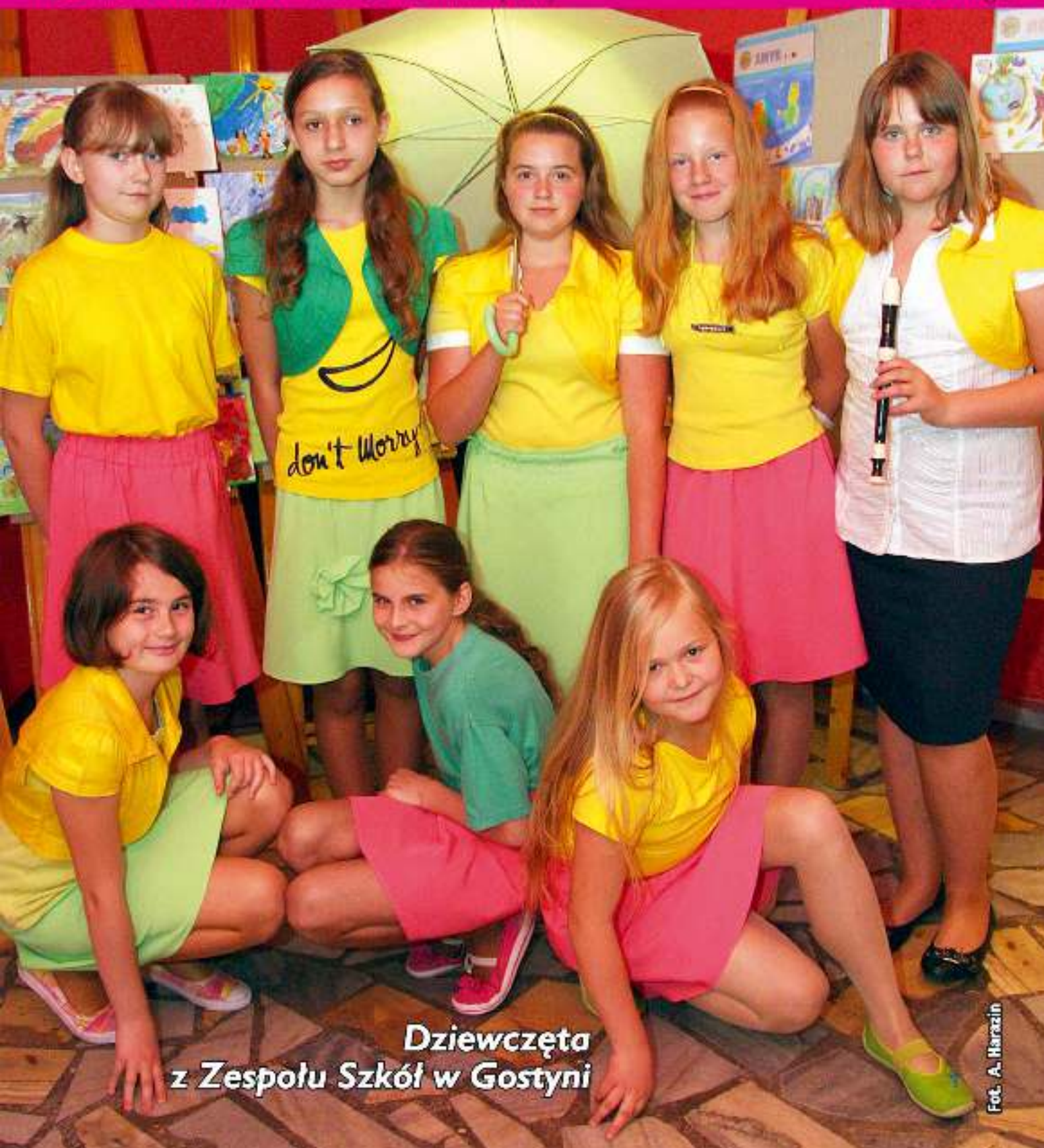
Dziewczęta z Zespołu Szkół w Gostyni