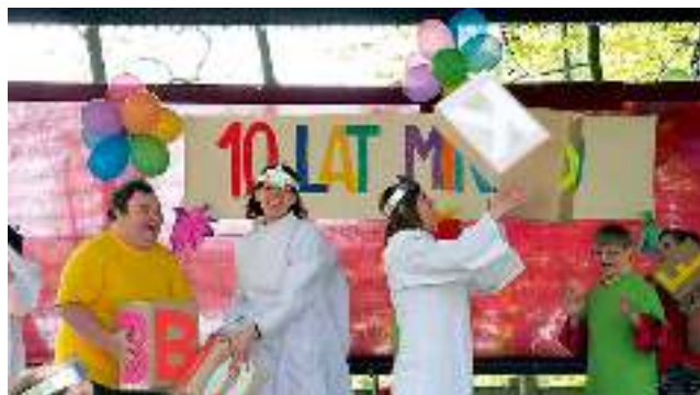
10-lecie Ośrodka Rehabilitacyjno-Wychowawczego w Wyrach. Więcej w następnym numerze.