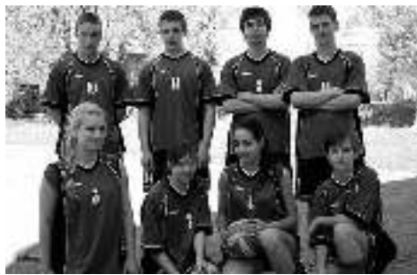
...i ZS w Gostyni