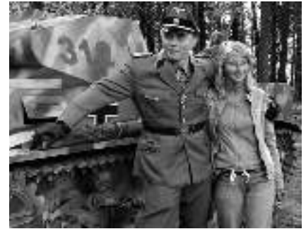
Pamiątkowe zdjęcie z Bitwy Wyrskiej 2007 r.

12.15-13.00 Prezentacja sprzętu i wyposażenia wojska polskiego