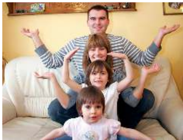
fort. A. MIKOŁAJEC

4 maja odbyła się uroczysta I Komunia święta w Kościele Podwyższenia Krzyża Świętego w Gostyni. Dzieci z parafii Najświętszego Serca Pana Jezusa w Wyrach i Parafii Świętych Apostołów Piotra i Pawła z Gostyni przystąpiły do Pierwszej i Wczesnej Komunii Świętej 11 maja. Czekamy na zdjęcia z tych uroczystości. Mogą je do nas przysłać rodzice, dziadkowie, chrzestni.