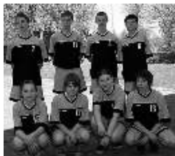
Drużyna ZS w Wyrach...