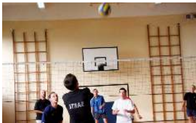
25 października odbył się II Powiatowy Turniej Siatkówki Strażaków – czyt. str. 6