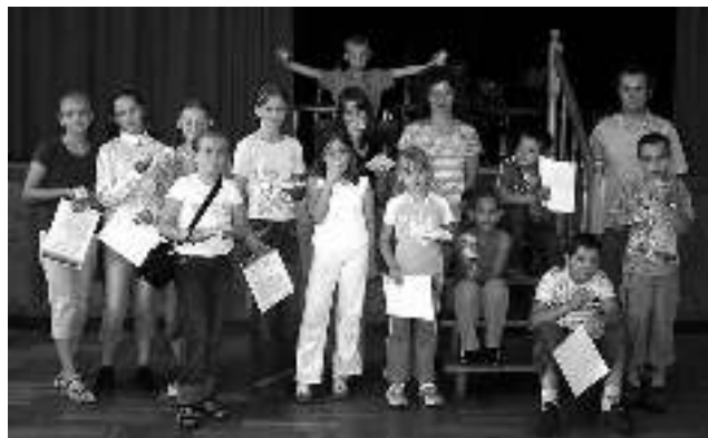
Jedna z grup biorących udział w Klubie Lato organizowanym przez Dom Kultury w Gostyni - czyt. str. 9.