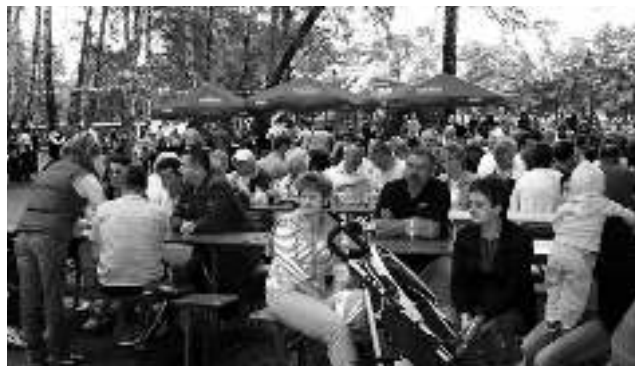
Tegoroczny festyn gminny zgromadził wielu mieszkańców i gości - czyt. str. 8.