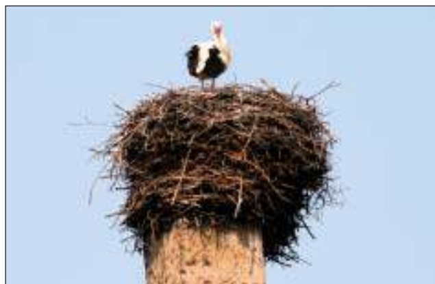
Nastała wiosna - bociany już przyleciały do Wyr.