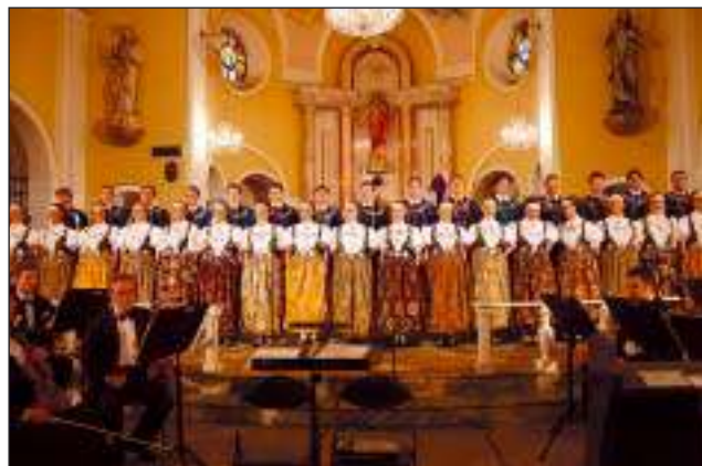
Pieśni pasyjne i wielkanocne zaśpiewał Zespół „Śląsk” – czyt. str. 9.