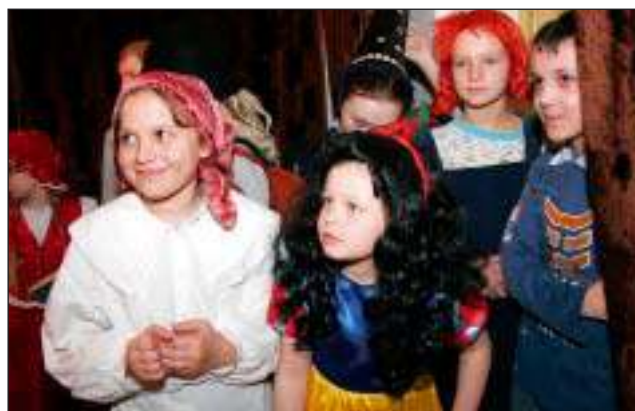
Teatr dla amatorów - czyt. str. 7.