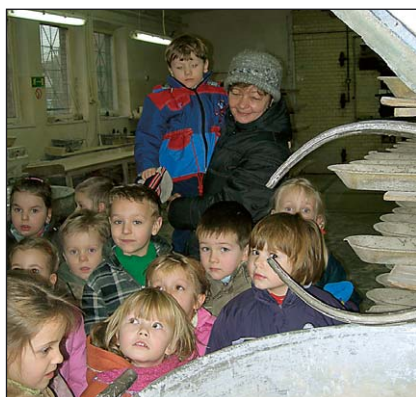
Przedszkolaki z Wyr.

Wyrę - Dla przyszłych przedszkolaków i ich rodziców organizujemy w maju tzw. „Dzień otwarty”, w którym to można przyjść i spędzić czas z dziećmi przedszkolnymi oraz tradycyjnie już obejrzeć przedstawienie w wykonaniu aktorów teatru „Skrzat” z Krakowa. Również w kwietniu, w czasie trwania rekrutacji zaprosimy do przedszkola na „Otwarte popołudnie” przyszłych przedszkolaków. Od kilku lat wysyłamy dzieciom 5- letnim listy – zaproszenia do odwiedzenia naszego przedszkola. W naszym niewielkim przedszkolu dysponujemy 4 salami zajęć oraz przestronnym placem zabaw znajdującym się za budynkiem z dala od głównej drogi. Wiosną tego roku plac zabaw zostanie wyposażony w nowe urządzenia rekreacyjne. W dniu dzisiejszym do przedszkola zapisanych jest 89 dzieci – tylu przedszkolaków w tych murach jeszcze nie było. Chętnych przybywa, a my niestety nie jesteśmy z gumy. Odnowione pomieszczenia, wyposażenie, pomoce dydaktyczne na bieżąco uzupełniane, a przede wszystkim kadra pedagogiczna i techniczna – gwarantują dzieciom komfort, bezpieczeństwo i fachowe podejście. Naszym mottem są słowa Phila Bosmansa „Dziecko jest chodzącym cudem, jedynym, wyjątkowym i niezastąpionym”.