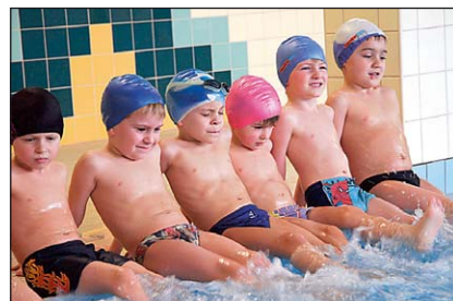
Przedszkolaki z Gostyni.

Gostyń - Organizujemy zajęcia płatne dodatkowo przez rodziców. To rytmika, język angielski, gimnastyka korekcyjna. Dzieci korzystają z kursu nauki pływania na brodziku przy Basenie Miejskim w Tychach. Kurs jest płatny. Jak do tej pory dojazd jest sponsorowany przez jednego z rodziców. Dzieci w przedszkolu bezpłatnie korzystają z terapii logopedycznej, zatrudniamy psychologa – dodaje dyrektor gostyńskiej placówki.