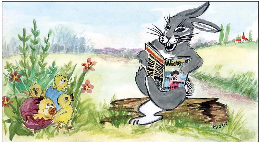
Rysunek wykonany specjalnie dla naszej Redakcji przez pana Alojzego Rzepkę.

Kiedyś chciał być wojskowym, ale z zawodu jest adiunktem służby handlowo-przewo-