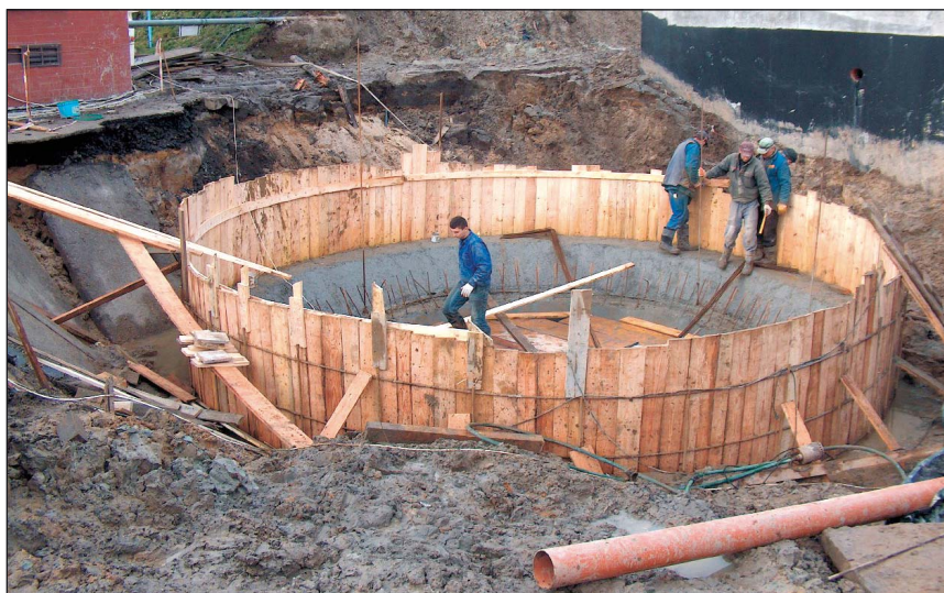
Osadnik wtórny OWT 1 – deskowanie ścian – styczeń 2007 r.

Realizacja tej inwestycji przyczyni się nie tylko do ochrony środowiska oraz zachowania zasobów naturalnych poprzez stworzenie technicznych możliwości odbioru ścieków powstających na terenie Gminy Wyrę oraz oczyszczenie ich do stopnia wymaganego przepisami polskimi i unijnymi, ale także do podniesienia komfortu życia mieszkańców gminy i wzrostu atrakcyjności terenów pod inwestycje, rozwój budownictwa mieszkaniowego oraz turystyki pieszej i rowerowej.