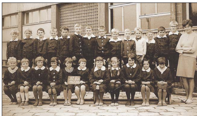
Klasa IV a