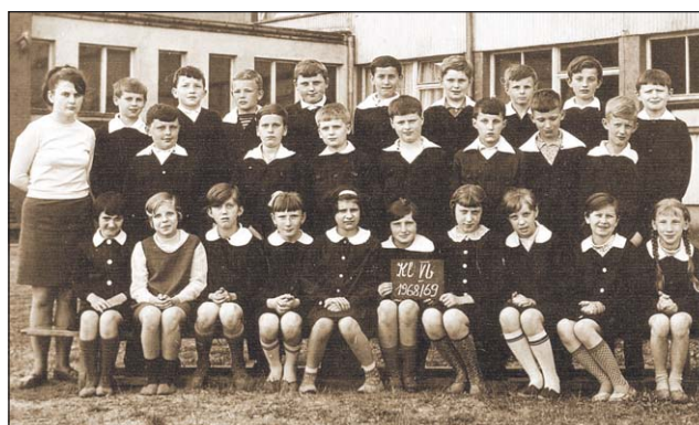
Klasa V b