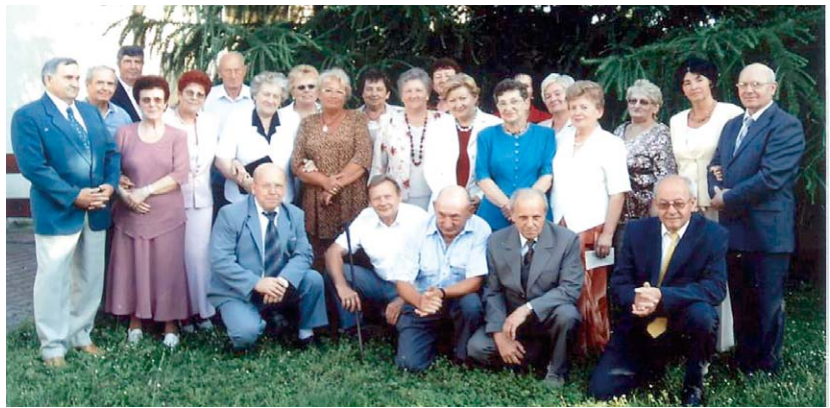
Rocznik 1943 dziś...

Aby upamiętnić te dni naszej wyrskiej chwały uchwaliliśmy jednogłośnie, by jedną z wyrskich