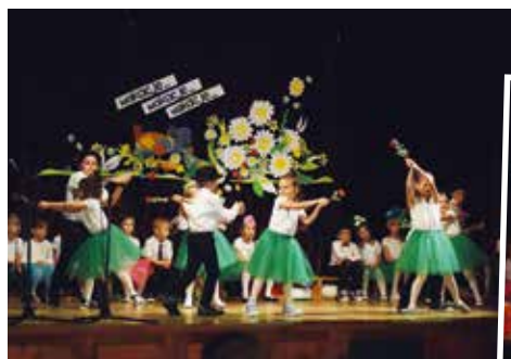
Zakończenie roku w gostyńskim przedszkolu przebiegało z towarzyszeniem tanecznych rytmów i było pełne radosnej zabawy