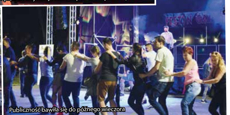
Publiczność bawiła się do późnego wieczora