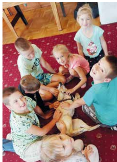
...a także podczas zajęć ze szczególnie lubianej dogoterapii oraz na żarskim placu zabaw