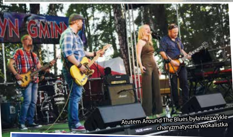
Atutem Around The Blues była niezwykle charyzmatyczna wokalistka