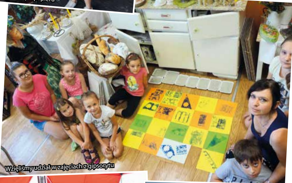
Wzięliśmy udział w zajęciach z gipsorytu