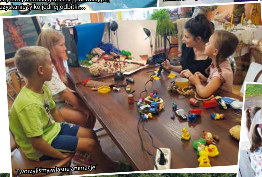
Tworzyliśmy własne animacje