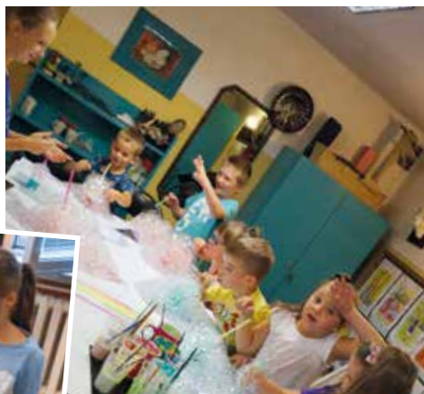
Malowaliśmy kolorową pianą