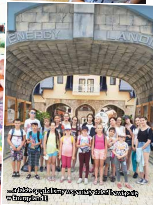
...a także spędziliśmy wspaniały dzień bawiąc się w Energylandii!