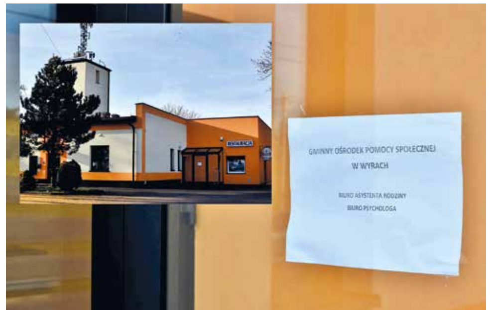
Zarówno dyżury psychologa, jak i konsultanta dla rodzin będących w konflikcie i przemocy, odbywać się będą w budynku Ochotniczej Straży Pożarnej w Wyrach przy ul. Pszczyńskiej 78