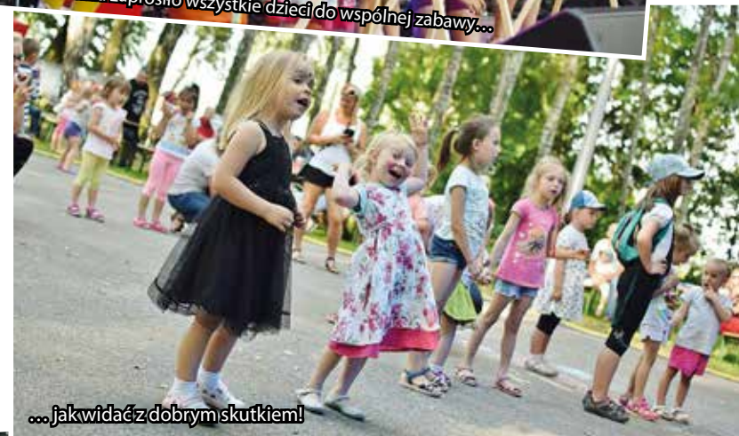
...jak widać z dobrym skutkiem!