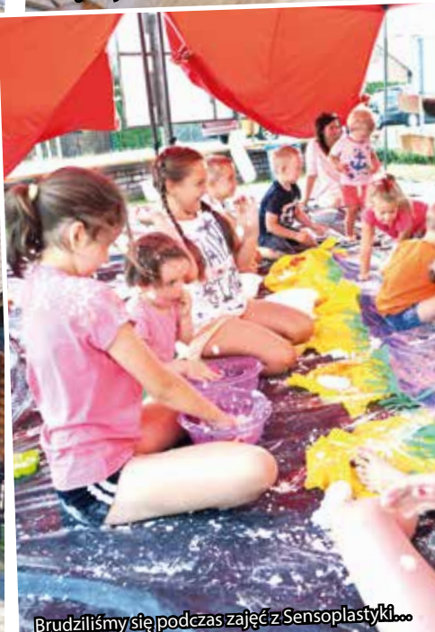
Brudziliśmy się podczas zajęć z Sensoplastyki...