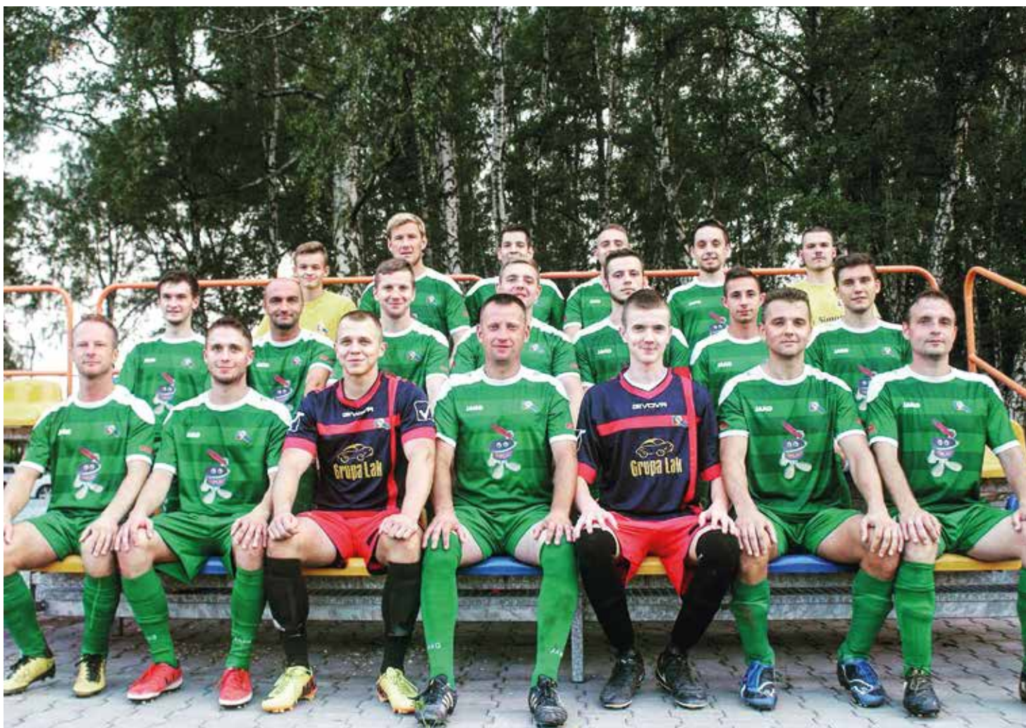
Skład Fortuny Wyry w sezonie 2017/2018

Gmina Wyry Gór-Serwis Salmax Kuchmar Klostar BMW Sikora Mikołów Sala Zabaw Nibylandia Katowice Sport Active Przewozy autokarowe Voyager P'mix Moto Punkt Lisdor Technika Grzeczwa Serdecznie dziękujemy!