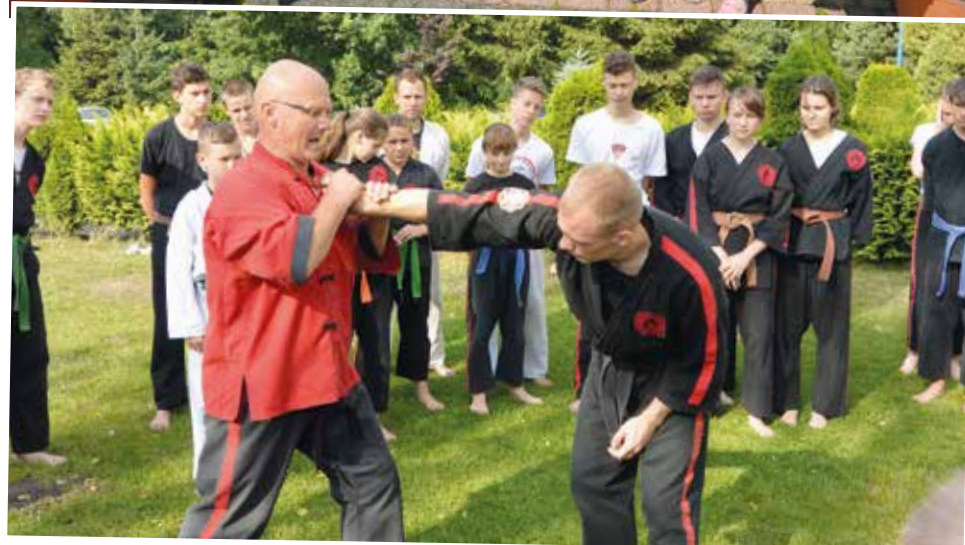
Uczestnicy obozów szlifowali swoje umiejętności