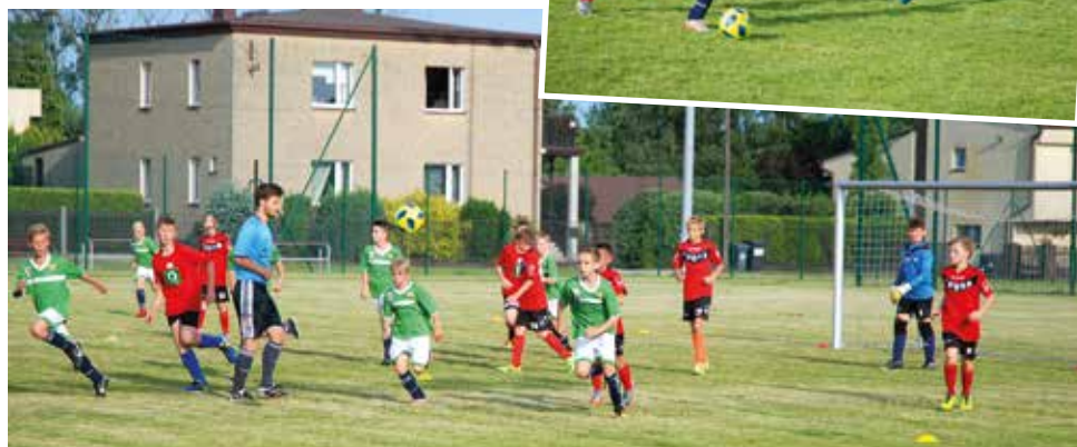
Podczas pikniku Raków odbył się m.in. mecz piłkarski, miniturniej dla wszystkich uczestników oraz kilka mniejszych gier i zabaw dla najmłodszych