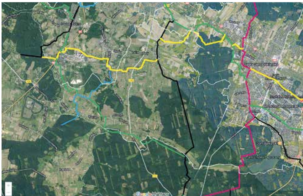
Przez obszar naszej gminy mają przebiegać aż trzy trasy (o numerach 133, 137 oraz 147)