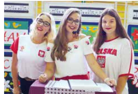
Jednym z tegorocznych wydarzeń był ogólnoszkolny quiz „Kocham Cię Polsko!”, oparty na formule znanego programu telewizyjnego

go Dnia Wiosny, na Szkolnym Pikniku Rodzinnym oraz na zwieńczeniu innowacji pedagogicznej „Kocham Cię Polsko!” w związku z przypadającym w tym roku 100-leciem odzyskania przez Polskę niepodległości. Celem tej innowacji było przybliżenie uczniom historii, tradycji, piękna i kultury naszej ojczyzny. Podsumowaniem tej innowacji był ogólnoszkolny quiz pod