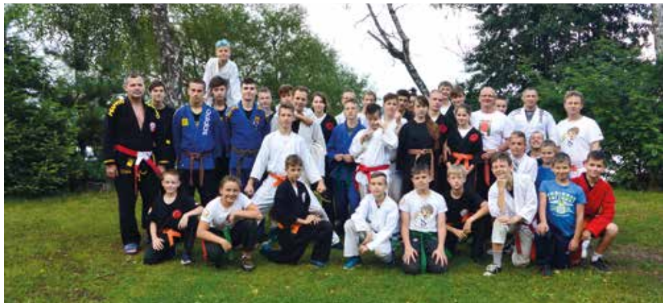
Wojownicy jak co roku wyjechali na obozy sportowe na Pogorię w Dąbrowie Górniczej