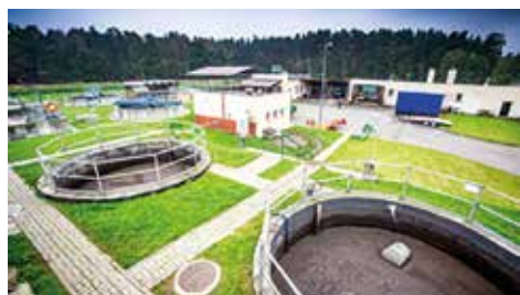
Dzięki gminnej dotacji ceny będą niższe

W ubiegłym roku weszła w życie nowelizacja ustawy o zbiorowym zaopatrzeniu w wodę i zbiorowym odprowadzaniu ścieków. Taryfy za wodę i ścieki po raz pierwszy nie zostały zatwierdzone przez organy gminne, lecz przez dyrektorów Regionalnych Zarządów Gospodarki Wodnej Państwowego Gospodarstwa Wodnego Wody Polskie, co spowodowało wzrost stawek za odprowadzanie ścieków.