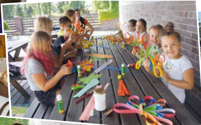
Tworzyliśmy kolorowe kwiaty z papieru