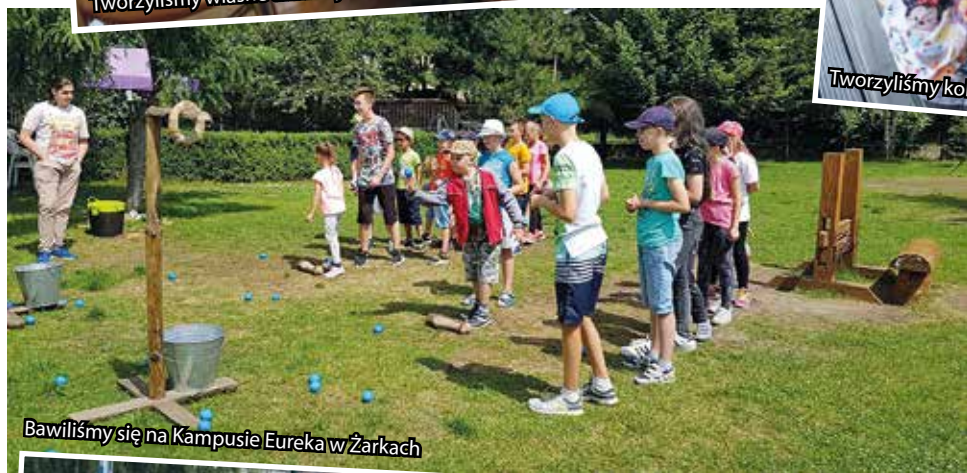
Bawiliśmy się na Kampusie Eureka w Żarkach