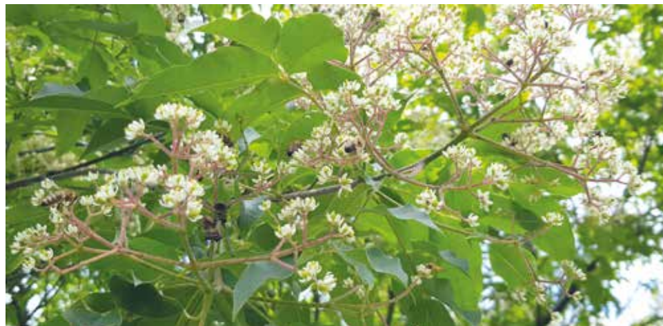
Kwitnąca od czerwca do sierpnia ewodia aksamitna to jedno z najbardziej miododajnych drzew w Polsce

Polski Związek Pszczelarzy – Koło Pszczelarzy w Wyrach wyraziło w sprawie odkleszczania pisemny protest, uzasadniając go poważnymi, negatywnymi konsekwencjami dla ekosystemu. Nie ma wybiórczego preparatu na kleszcze. Opryski stanowią zagrożenie dla wszystkich organizmów. Także dla ludzi. Co rowerzyście po tym, że „nie złapie kleszcza”, jeśli zje maliny, które zostały opryskane. To również stanowi zagrożenie dla jego zdrowia – dodaje Krzysztof Patalong. Tłumaczy również, jak duże znaczenie mają pszczoły dla ekosystemu: – Pszczoły miodne zapylają rośliny przy