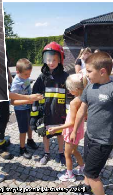
Mogliśmy się poczuć jak strażacy w akcji!