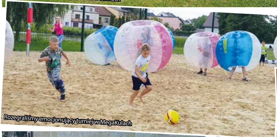
Rozegraliśmy emocjonujący turniej w Mega Kulach