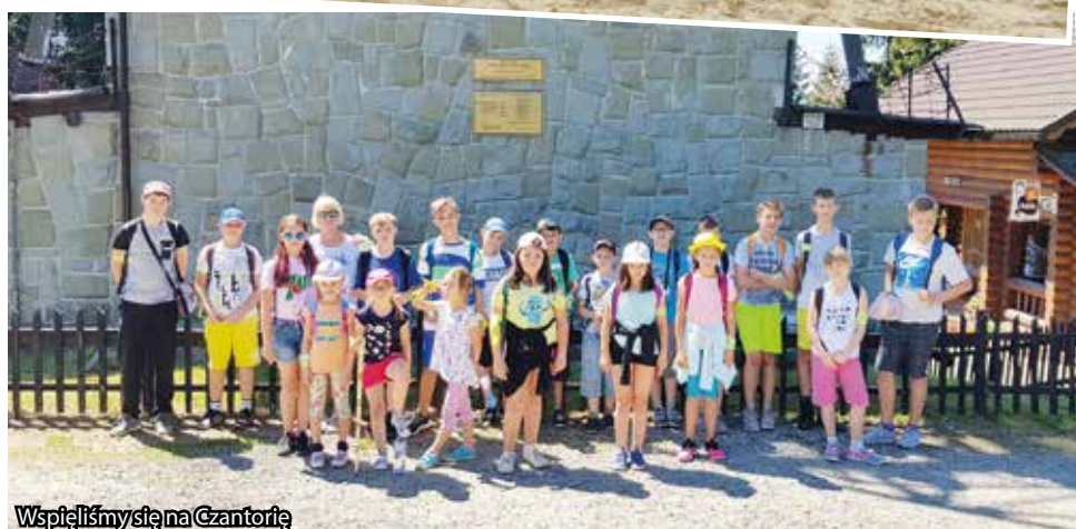
Wspięliśmy się na Czantorię