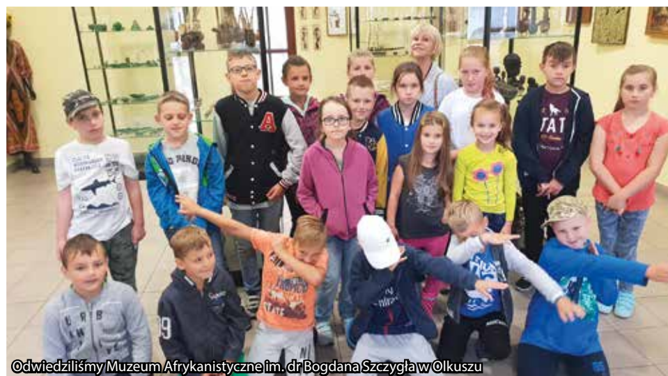
Odwiedziliśmy Muzeum Afrykanistyczne im. dr. Bogdana Szczygła w Olkuszu