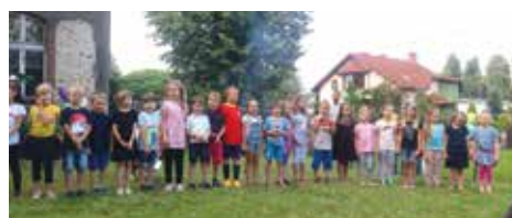
Grupa Misie zabrała rodziców w magiczną podróż do czasów, kiedy byli jeszcze dziećmi...