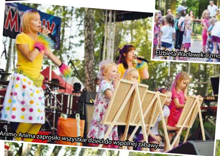
Animo Anima zaprosiło wszystkie dzieci do wspólnej zabawy...