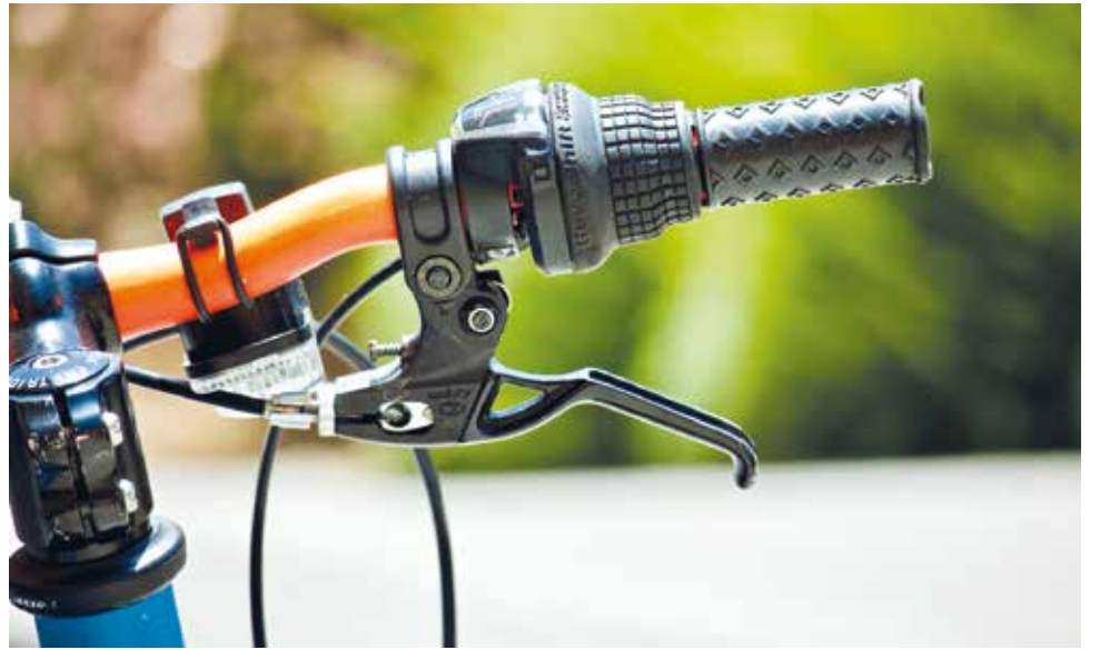
Jadąc na wycieczkę pamiętajmy o zachowaniu podstawowych zasadach bezpieczeństwa na rowerze

jest dopuszczalna, jeżeli nie utrudnia to poruszania się innym uczestnikom ruchu albo w inny sposób nie zagraża bezpieczeństwu ruchu drogowego.