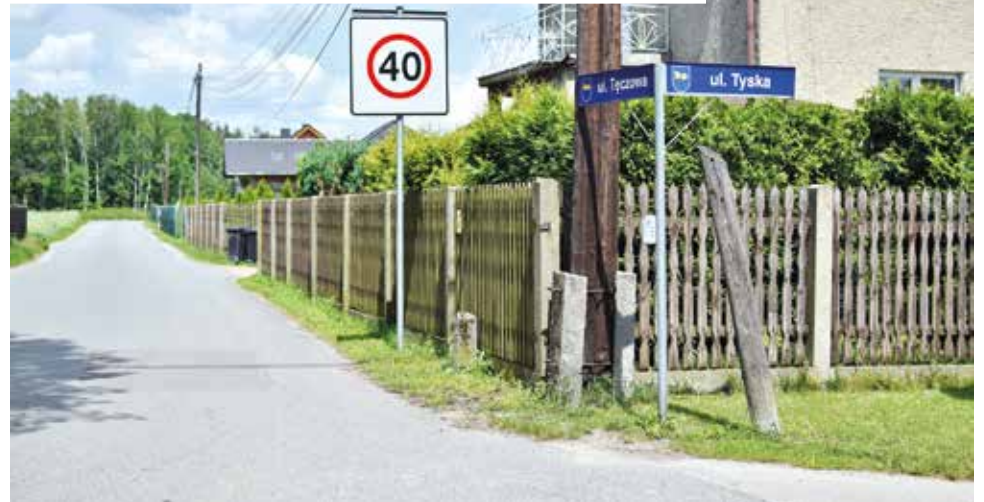
Projekt przebudowy ulic Tyskiej i Tęczowej w Gostyni oraz Wagonowej w Wyrach ma być gotowy do 14 grudnia

WICIE – Miesięcznik Samorządowy Gminy Wyry. ISSN 1731-9501