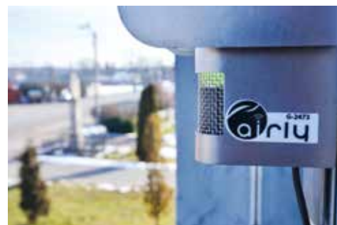
Stan powietrza można sprawdzić na stronie https://airly.eu/pl/