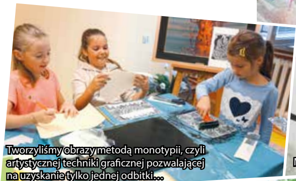
Tworzyliśmy obrazy metodą monotypii, czyli artystycznej techniki graficznej pozwalającej na uzyskanie tylko jednej odbitki...