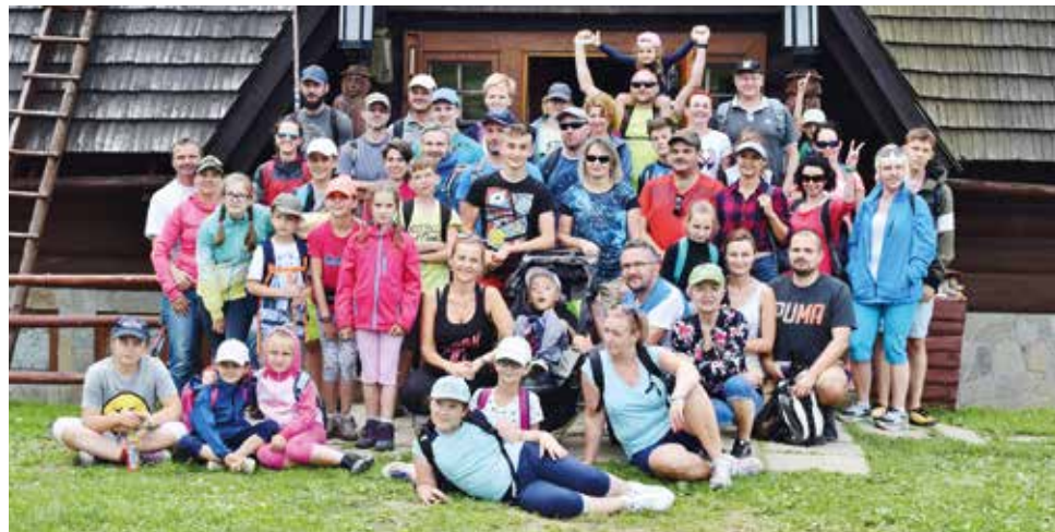
Rajd górski jak co roku cieszył się dużym zainteresowaniem mieszkańców