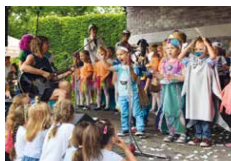
Czerwiec "Troskliwe Misiu" spędzili bardzo aktywnie i wesoło