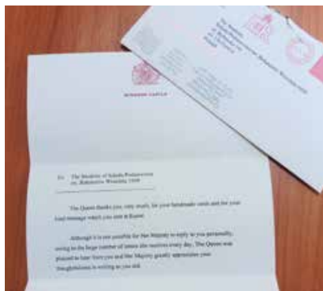
Oficjalna odpowiedź od Jej Królewskiej Mości

Doskonałą okazją ku temu były Święta Wielkanocne. W akcję przygotowania przesyłki zaangażowali się wszyscy uczniowie. Pod okiem nauczycielek języka angielskiego młodszy uczniowie wykonali kartki świąteczne z życzeniami dla brytyjskiej monarchini, starsi napisali list, w którym krótko opowiedzieli o naszej szkole i kilku świątecznych zwyczajach. Dużą niespodzianką była odpowiedź, jaka nadeszła po dosyć długim czasie oczekiwania. W imieniu Jej Wysokości podziękowano uczniom