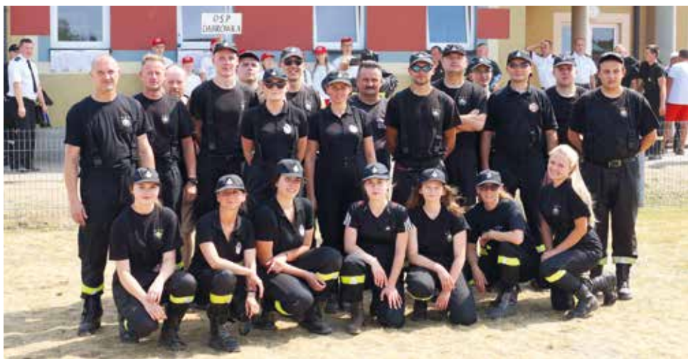
Podczas zawodów drużyny rywalizowały w ćwiczeniu bojowym oraz biegu sztafetowym 7 x 50 m