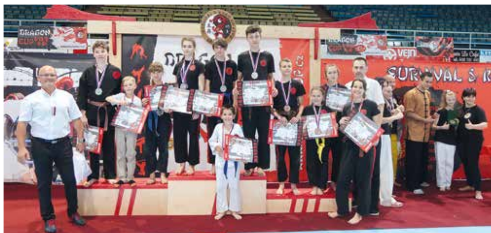
Wojownicy wywalczyli aż 18 medali