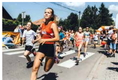
Kolejny raz padły rekordy trasy