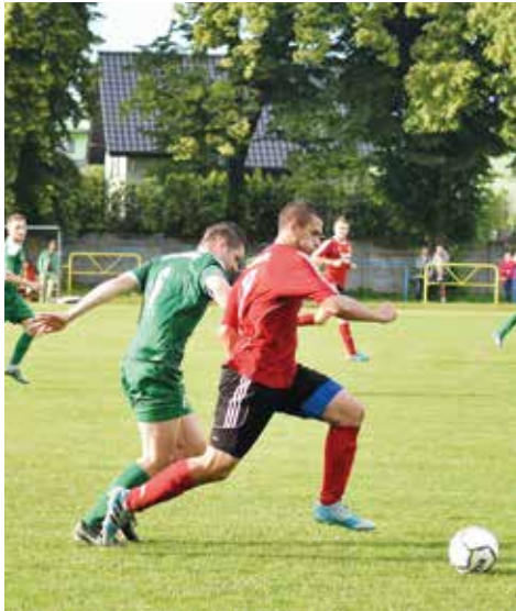
Mecz Znicz Jankowice-Fortuna Wyrzy nasi zawodnicy wygrali 2:0

Za nami Festyn Rodzinny, który 2 czerwca na boisku im. Braci Góralczyków zgromadził sporą grupę dzieci, młodzieży oraz dorosłych, którzy mimo kapryśnej pogody świętowali wspólnie Międzynarodowy Dzień Rodziny. Wydarzenie zorganizował Klub Sportowy Fortuna Wyrzy wraz z Domem Kultury w Gostyni.