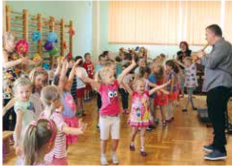
Dziecięca podróż z fletem przez świat...