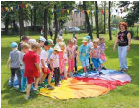
Wesołe zabawy w ogrodzie przedszkolnym