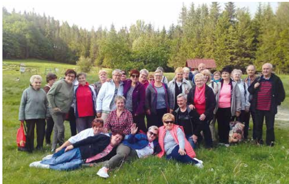
Wycieczka na korbielowski redyk co roku cieszy się dużym zainteresowaniem