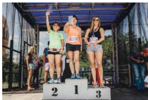
Podium w kategorii mieszkanek Gminy Wyry