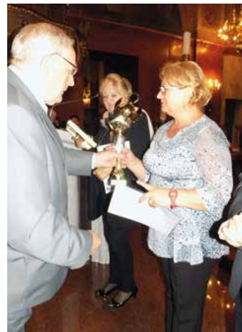
Odebranie pucharu za III miejsce na festiwalu w Piekarach Śląskich