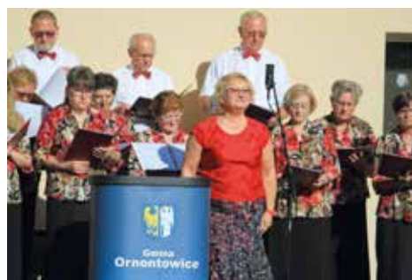
Występ Zorzy podczas Ornontowickich Dni Kultury