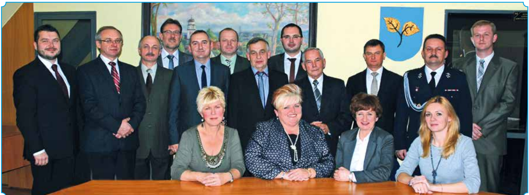
Obecna VII kadencja Rady Gminy Wyr

W nowej kadencji należy kontynuować działania zmierzające do dalszej rozbudowy kanalizacji na ul. Rybnickiej oraz okolicznych ulicach. Ważna jest także współpraca z nowymi władzami powiatowymi w celu rozpoczęcia remontu nawierzchni na ul. Rybnickiej.