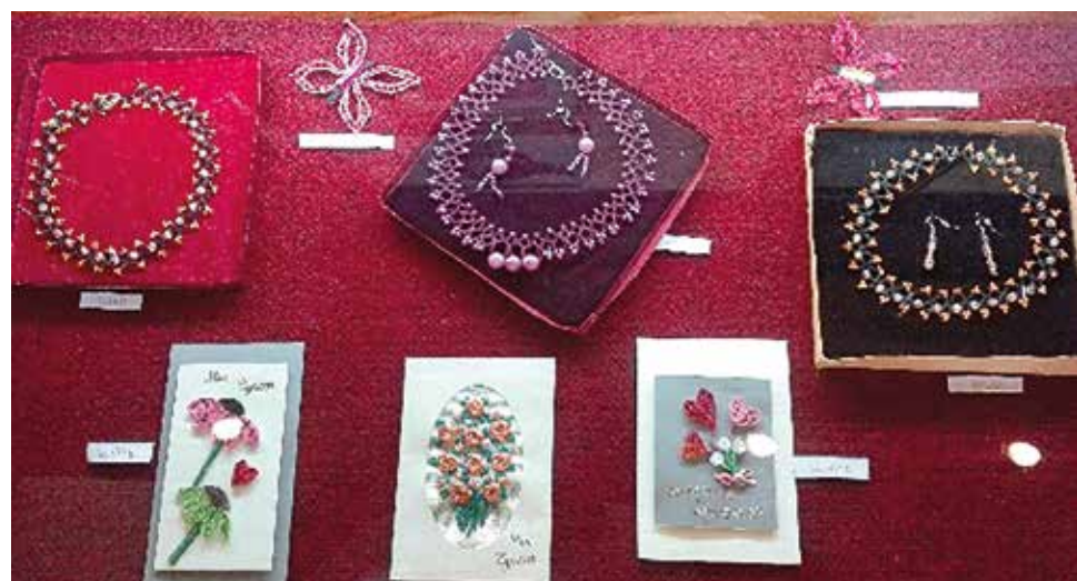
Prace z koronki klockowej Heleny Strzępy można oglądać w gminnej bibliotece