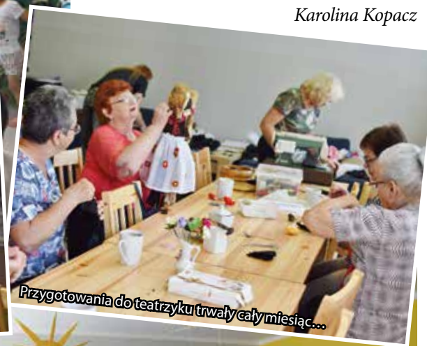
Przygotowania do teatryku trwały cały miesiąc...