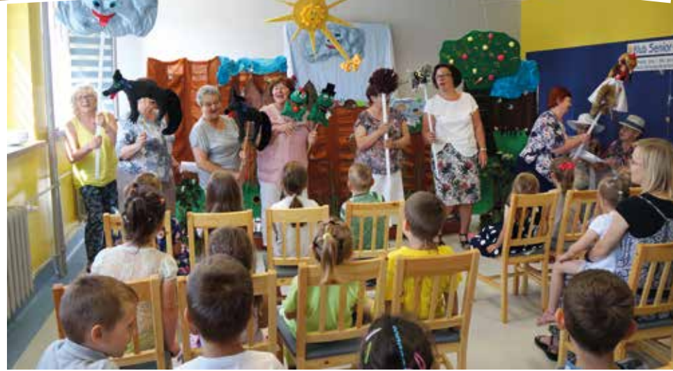
Wszystkie dzieci z wielkim zainteresowaniem obejrzały przygotowane przez seniorki przedstawienie