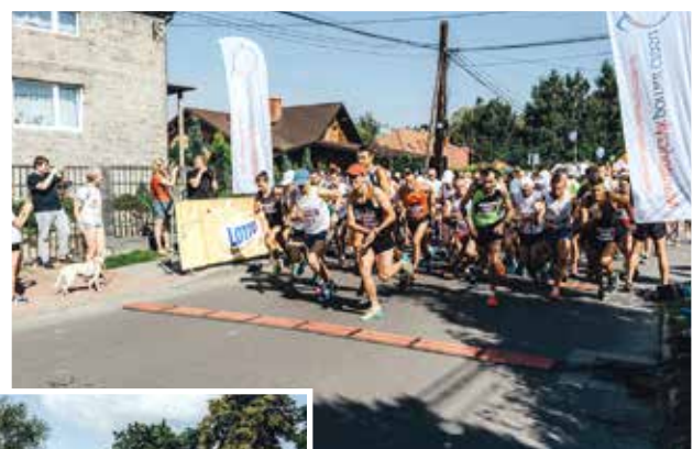
Ostatnie sekundy odliczania i... wystartowali!