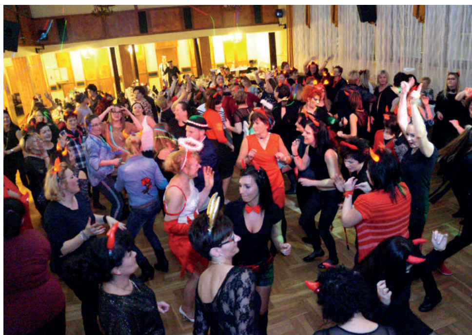
Tegoroczny Babski Comber odbył się pod hasłem „Anielice i diabllice”

Szpeciallynie warta zapamiętania była wycieczka ścieżkami Ojcowskiego Parku Narodowego, w którym to odwiedziły barokowy kościół i pustelnię bł. Salomei: Jest tam taki wielki betonowy słoń, którego trzeba poklepać na szczęście – wspominają z uśmiechem klubowiczki. – Ta pustelnia jest na niesamowitym odludziu. Bardzo