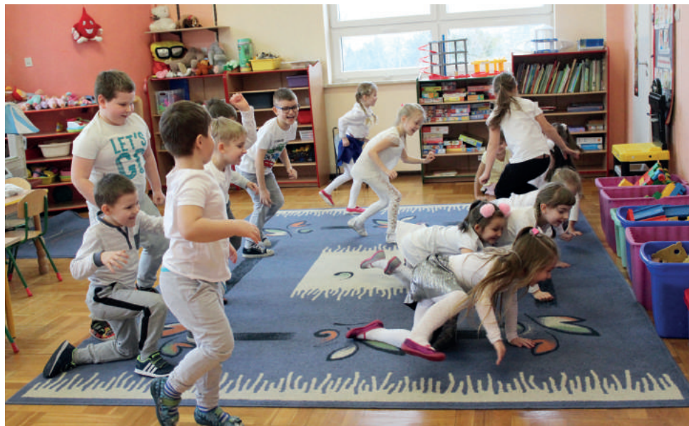
Zabawa i gimnastyka to świetny sposób na połączenie przyjemnego z pożytecznym