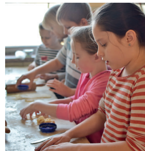
Wyrobienie kruchego ciasta okazało się nie lada wyzwaniem...