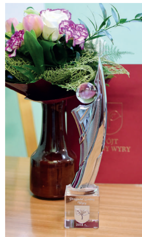
Statuetka „Przyjaciela Gminy Wyrów”

To tylko skromny wycinek z działalności wyrskiego Klubu Kobiet Aktywnych. Bez wątpienia jego uczestniczki przeżyły dużo. Bardzo dużo. Ale jeszcze więcej przed nimi. Oczywiście dołączamy się do życzeń wójt gminy i wszystkich radnych zgromadzonych na wyjątkowej sesji, podczas której przewodnicząca Klubu Kobiet