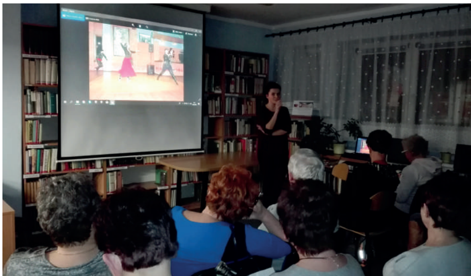
Już 4 czerwca Stowarzyszenie Podróżników TRAMP wyruszy do Gruzji

Pełna niespodzianek wyprawa przez Gruzję i jej malownicze regiony rozpocznie się 4 czerwca w Tbilisi, stolicy kraju. Podczas prawie dwutygodniowego pobytu podróżnicy z Wyr i Gostyni zobaczą najciekawsze miejsca i zabytki, spróbują specjałów lokalnej kuchni, a także poznają tajniki produkcji słynnego gruzińskiego wina. Niezapomnianych wrażeń dostarczy też bogactwo kaukaskiej przyrody, której szczególnie urok ujawnia się najbardziej właśnie na przełomie wiosny i lata.