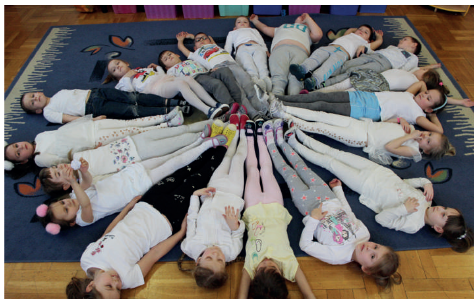
Tego dnia wszystkie zabawy i konkurencje związane były tematycznie z zimą