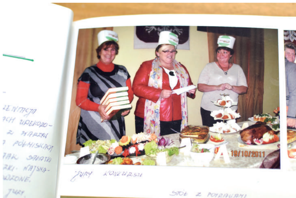
Klub Kobiet Aktywnych znany jest także z organizacji konkursów kulinarnych

Panie z KKA mają na swoim koncie wyjazdy m.in. do teatrów w Krakowie,