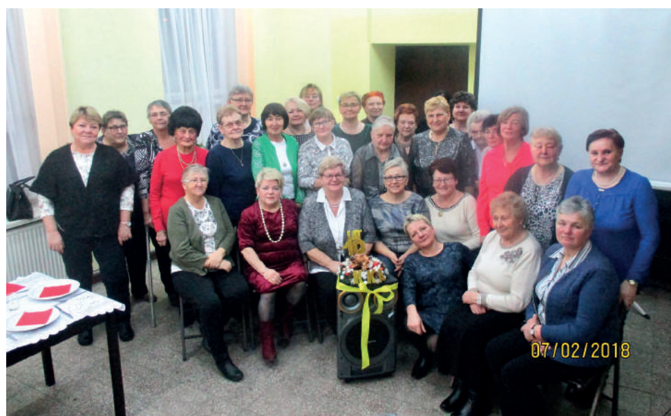
Dokładnie 7 lutego Klub Kobiet Aktywnych świętował swoje 10-lecie