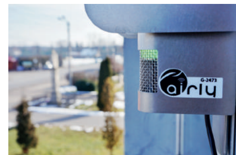
Czujniki zainstalowano na budynku Domu Kultury w Gostyni oraz Szkoły Podstawowej w Wyrach

Czujnik w Wyrach zamontowany został na budynku szkoły podstawowej, zaś w Gostyni na budynku domu kultury. Aby sprawdzić jakość powietrza przed wyjściem z domu należy wejść na stronę https://airly.eu/pl/ , a następnie wejść w zakładkę Mapa. Kolejny krok to kliknięcie w interesującą nas lokalizację czujnika,