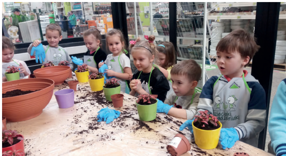
Przyniosło im to mnóstwo dobrej zabawy