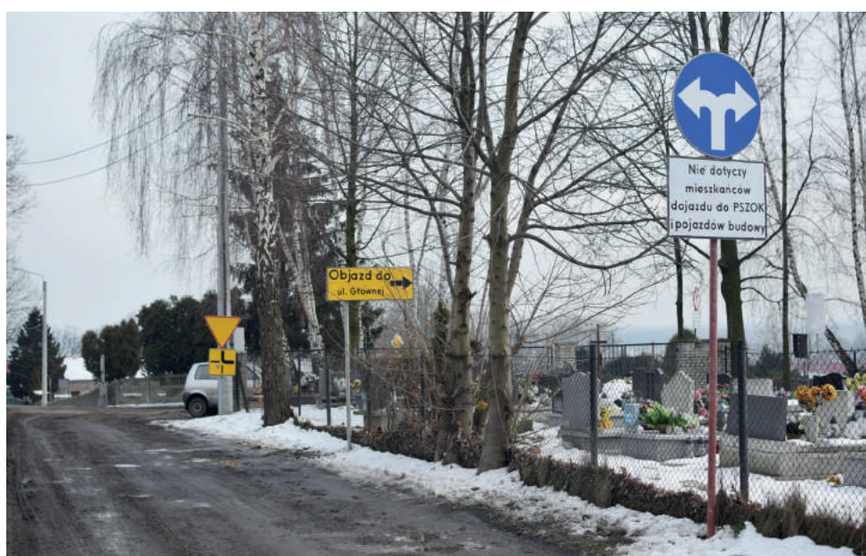
Pamiętajmy o zmianie organizacji ruchu w okolicy ul. Słonecznej

Referat Gospodarki Komunalnej i Inwestycji Urzędu Gminy Wyry