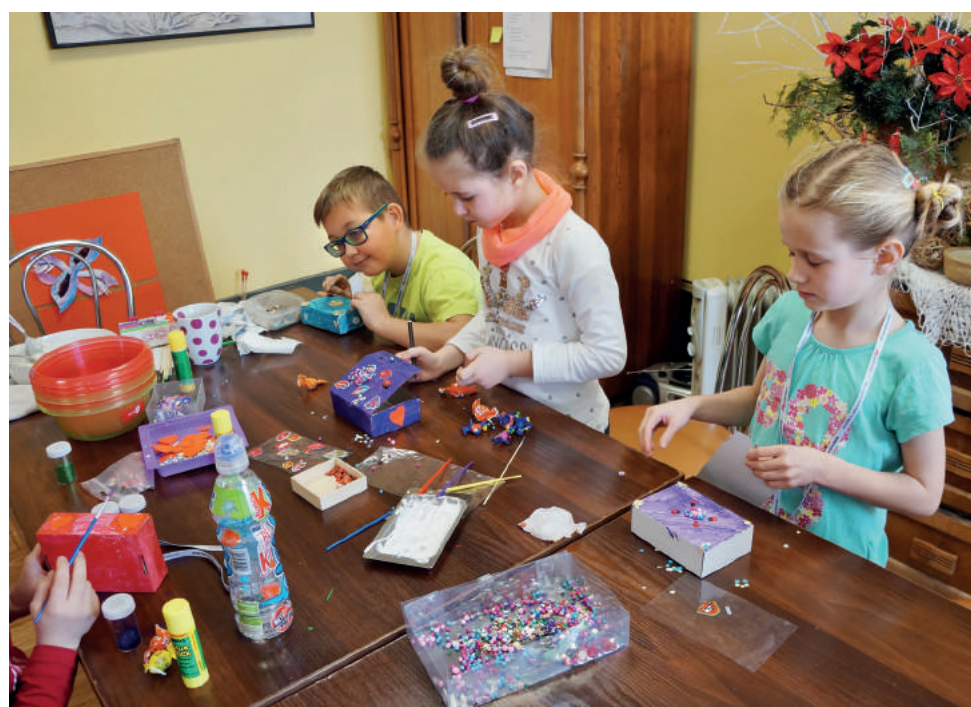
Wszystkie skrzynki wyszły pięknie i kolorowo, przyozdobione cekinami, koralikami, czy brokatem