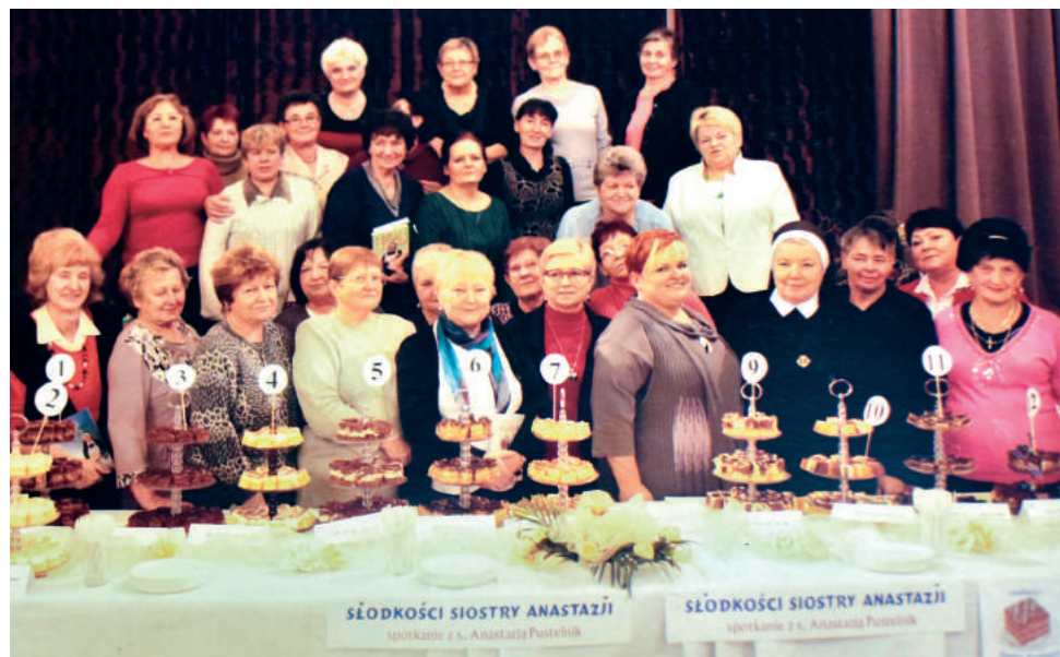
Spotkanie z siostrą Anastazją

Od tamtej pory Klub Kobiet Aktywnych się rozrastał, aż do obecnych rozmiarów – 37 pań. Panie ustaliły, że będą spotykać się raz w miesiącu, sporządziły oficjalny regulamin, ramowy plan pracy i tak działalność KKA ruszyła pełną parą. Jego celem jest nie tylko aktywizacja mieszkanek naszej gminy, ale także kontynuowanie i podtrzymywanie tradycji i zwyczajów regionalnych.