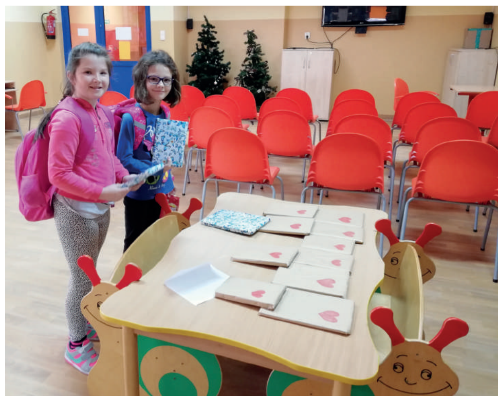
Akcja bez wątpienia miała na celu promowanie czytelnictwa, liczba wypożyczeń w tych dniach zwiększyła się kilkukrotnie