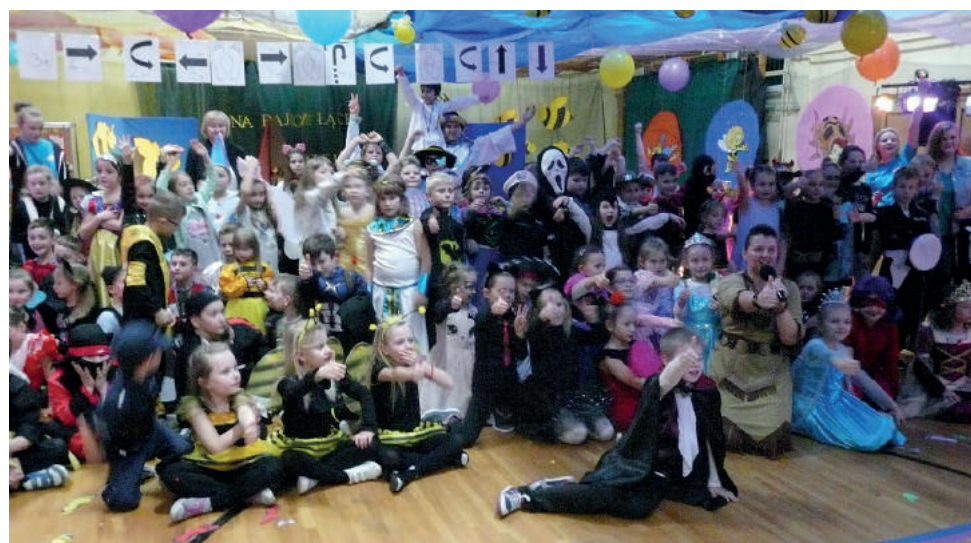
Jednym z elementów „Nocy z Bajką i Baśnią” był barwny bal przebierańców

Wreszcie nadszedł czas na rozpoczęcie niesamowitych i ciekawych przygód, które czekały na uczestników w formie różnorodnych warsztatów – spotkanie z fizyką i doświadczenia, kodowanie i programowanie, zabawy z żelowymi kulkami czy zabawy z wodzirejem. Po ciekawych doświadczeniach przyszedł czas na kolację z kanapkami i pyszną pizzą. Niedługo potem dzieci przebrały się do przygotowanych