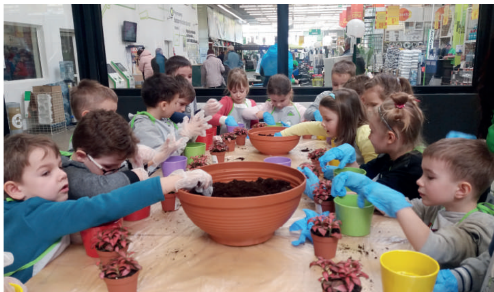
Dzieci mogły poczuć się jak ogrodnicy i samodzielnie zasadzić roślinkę