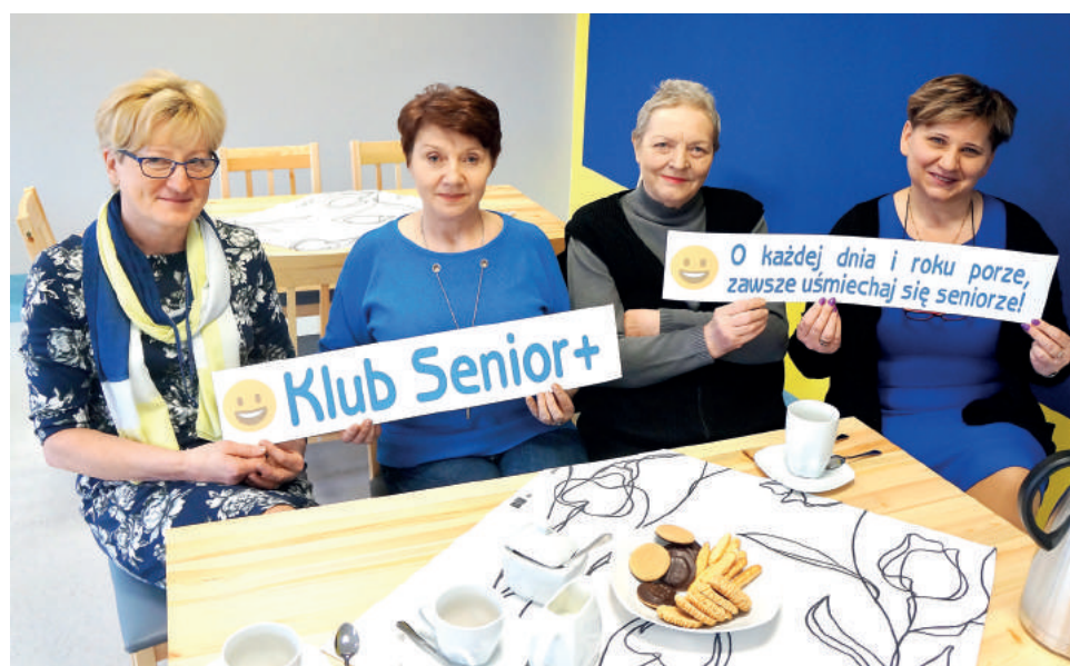
Uczestniczki Klubu Senior + zapraszają!

Dzień Kobiet – „Kobieta ósmy cud świata”. Przy kawie i słodkim poczęstunku panie naszego Klubu świętować będą