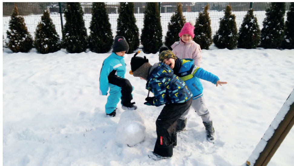
Pogoda dopisała, więc dzieci chętnie brały udział w zimowych zabawach