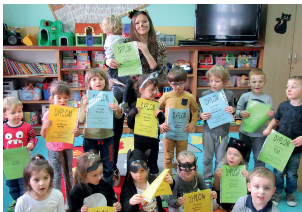
Celem Dnia Kota było zwrócenie uwagi ludzi na los porzuconych i bezdomnych zwierząt