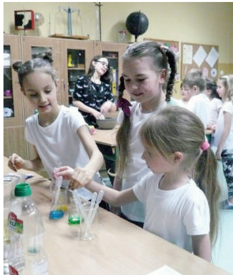
Na uczestników czekały różnorodne warsztaty, m. in. fizyczne, czy programistyczne

Impreza rozpoczęła się w piątek, 26 stycznia, punktualnie o 17.00, a zakończyła dzień później o godzinie 9.00. Biletem wstępu były różnorodne gry planszowe, które wspomogły Kącik gier planszowych zorganizowany w naszej szkole dla uczniów klas I – III.