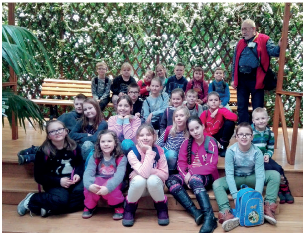
Wychowankowie gminnych świetlic środowiskowych w gliwickiej palmiarni