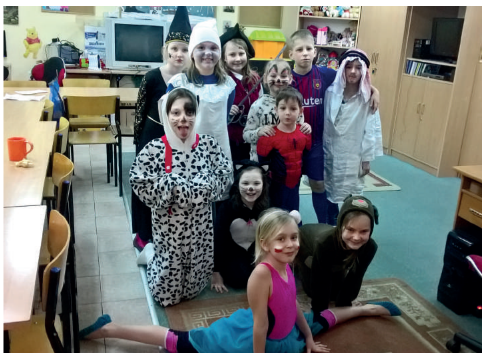
Ferie w gminnych świetlicach minęły bardzo radośnie i aktywnie