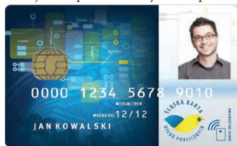
Spersonalizowana karta ŚKUP

Prawdziwą rewolucją jest wprowadzenie darmowych przejazdów dla dzieci i młodzieży do 16. roku życia. Z ulgi można korzystać w autobusach, tramwajach i trolejbusach z logo KZK GOP, MZKP Tarnowskie Góry i MZK Tychy. Żeby korzystać z bezpłatnych przejazdów, niezbędna jest spersonalizowana karta ŚKUP. Jeżeli uczeń nie ma jeszcze karty ŚKUP, wniosek o jej wyrobienie można złożyć w jednym z Punktów Obsługi Klienta lub Obsługi Pasażera. W Tychach zlokalizowane są dwa takie punkty: Kolporter, ul. Konfederatów Barskich 19 oraz ul. Dąbrowskiego 87 . Wszystkie punkty można znaleźć na stronie: portal.kartaskup.pl .