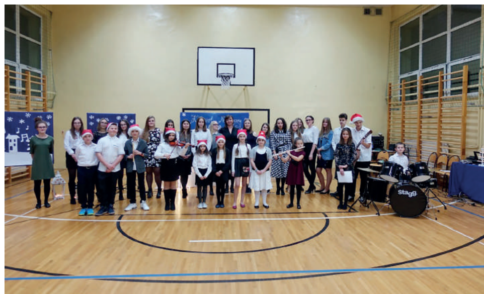
Można było usłyszeć najpiękniejsze kolędy i utwory świąteczne