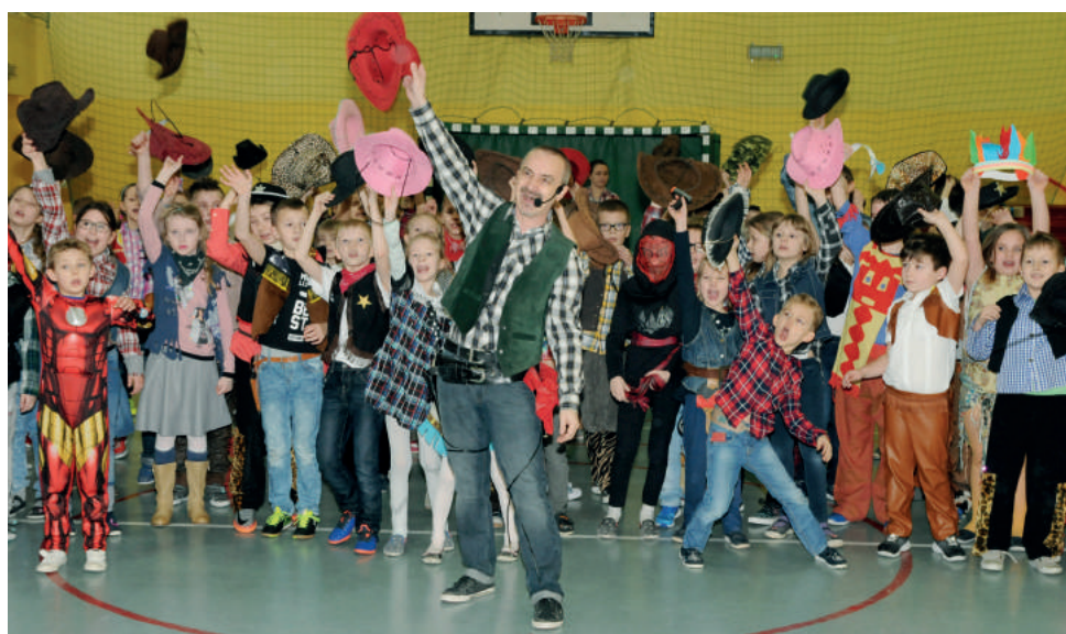
Uczniowie szkoły w Wyrach stworzyli prawdziwy dziki zachód!

niespodzianka przygotowana przez Radę Rodziców. Wspólne zabawy dostarczyły mnóstwo radości. Z pewnością pozostaną w pamięci wszystkich na długo.