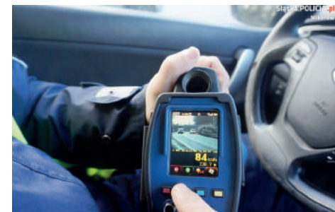
TruCam pozwala mierzyć prędkość lub zarejestrować wykroczenie z odległości nawet ponad jednego kilometra

Umożliwia to pokazanie przez policjanta zdjęcia lub nagrania pojazdu osobie kon-