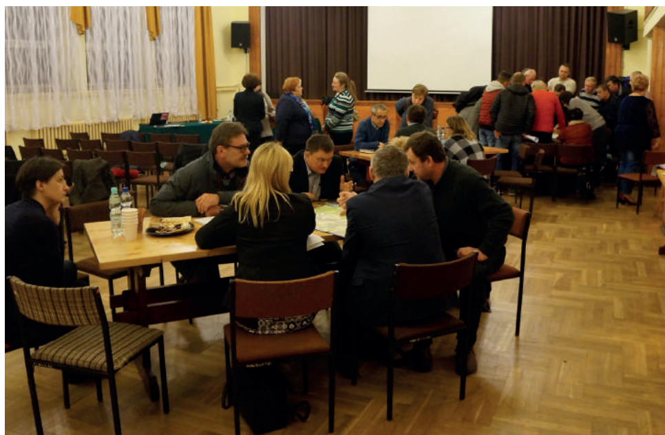
Dzięki takiej formie warsztatów mieszkańcy mogą aktywnie uczestniczyć w procesie planowania przestrzennego