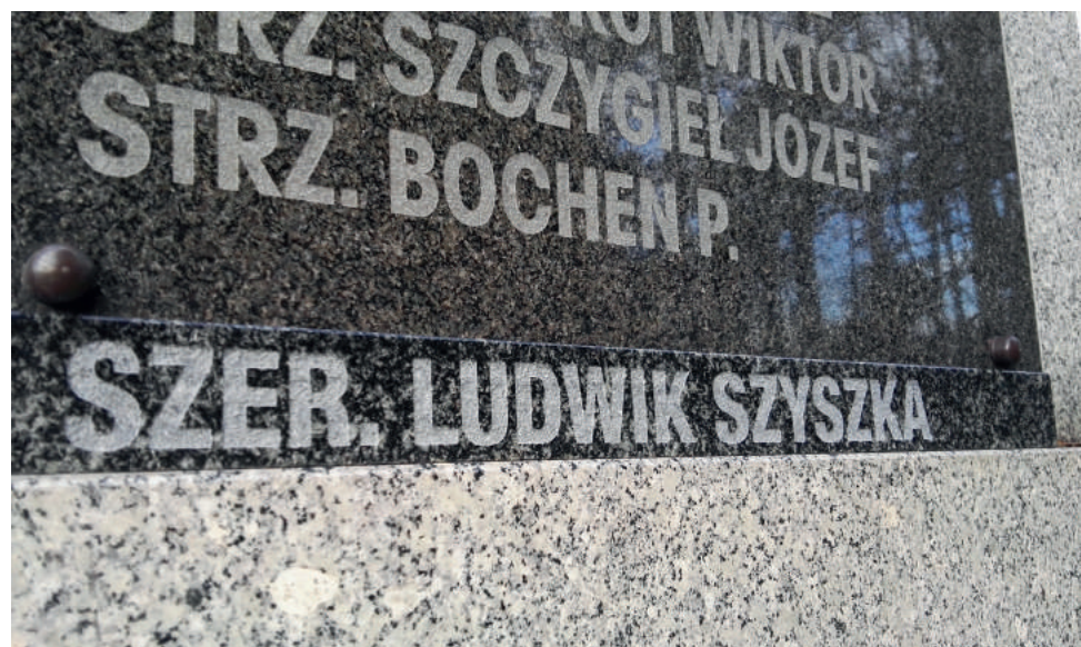
Uzupełniona pamiątkowa tablica na Pomniku Pamięci Żołnierzy Września 1939 roku w Gostyni