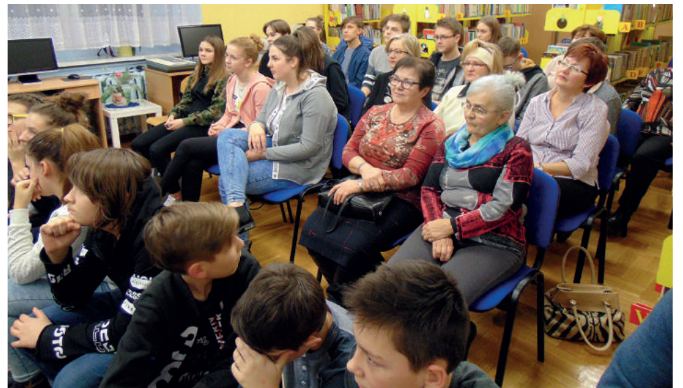
W spotkaniu wzięli udział uczniowie Szkoły Podstawowej i klas gimnazjalnych w Wyrach