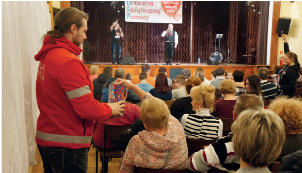
W tym roku zebrano ponad 7000 zł!