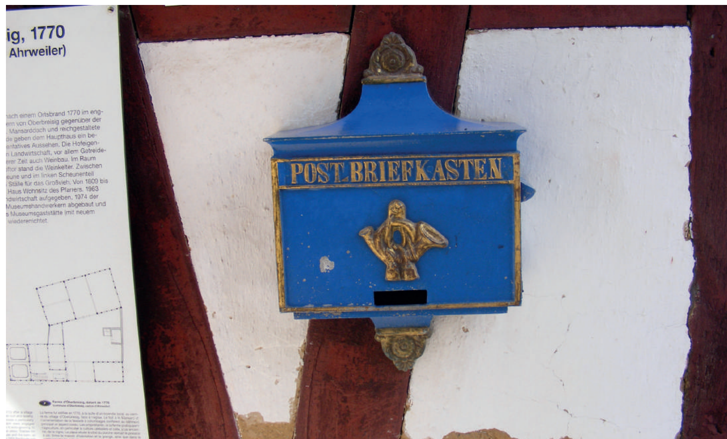
Skrzynka pocztowa (Skansen Kommern, Niemcy, Nadrenia-Westfalia, 2016 rok)

godniu kursował kurier z Mikołowa, przewożąc nieograniczoną ilość przesyłek. Kurier wyruszał o 6:00 z Mikołowa i był w Tychach o 7:30. O 12:30 wracał z powrotem i o 14:00 docierał do Mikołowa, więc przesyłki można było wysłać drugim pociągiem do Katowic. W tygodniu placówka była czynna w godzinach 8.00 – 12.00 i 14.00 – 17.00 natomiast w niedzielę w godzinach 8.00 – 9.00 i 17.00 – 18.00.