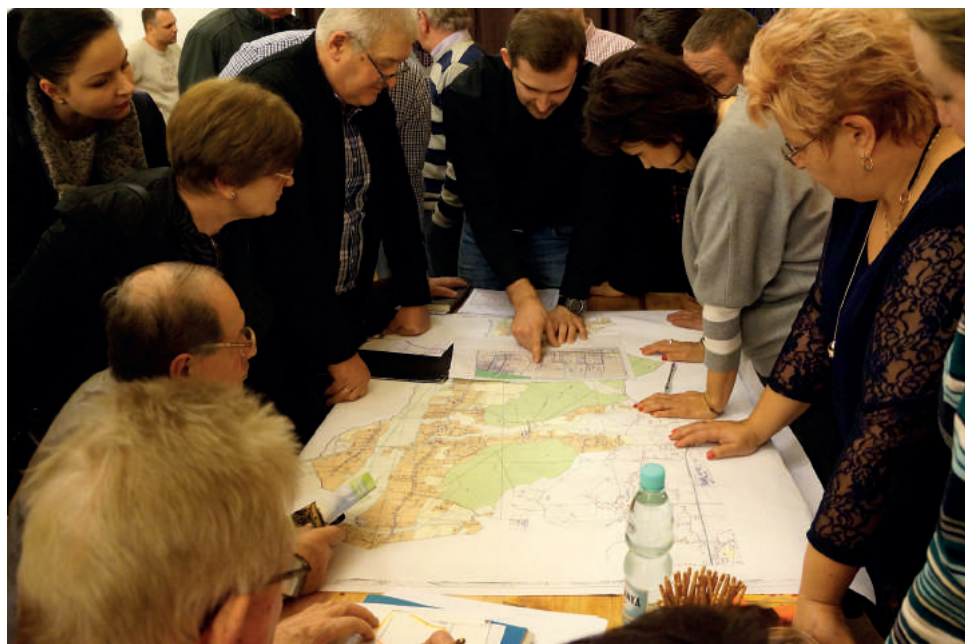
Styczeniowe spotkania były kolejnym etapem konsultacji i polegały na dyskusji przy stolikach z ekspertami poszczególnych dziedzin

Dzięki warsztatom konsultacyjnym mieszkańcy gminy mogli aktywnie uczestniczyć w procesie planowania przestrzennego. Ich opinie zebrane podczas