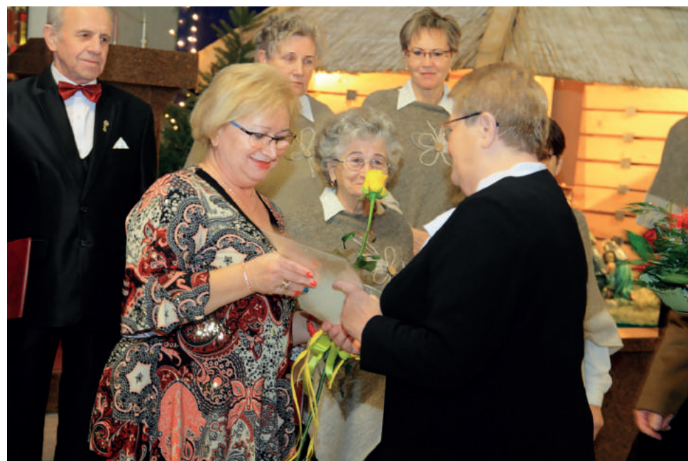
Za każdy występ „Zorza” odbiera liczne gratulacje