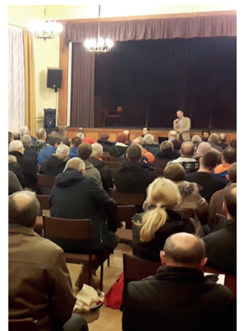
Tylko do 28 lutego można składać wnioski o udział w projekcie