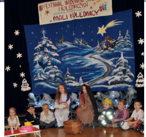
Spektakl „Pracowite Boże Narodzenie”

Występując w przedstawieniu jasełkowym „Pracowite Boże Narodzenie”, dzieci chciały pokazać jak ważna i potrzebna jest praca każdego człowieka, który rzetelnie wykonując swoje obowiązki może służyć ludziom i Bogu. Misie na scenie w profesjonalnych strojach prezentowały się i odgrywały swoje role naprawdę zawodowo. Naszą pracę dostrzegło jury w składzie te-