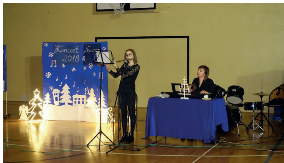
Była to świetna okazja żeby zaprezentować swoje talenty muzyczne