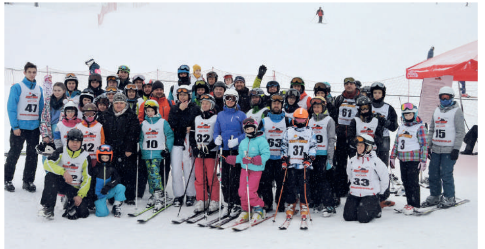
W rywalizacji wzięło udział aż 65 zawodników w 13 kategoriach wiekowych