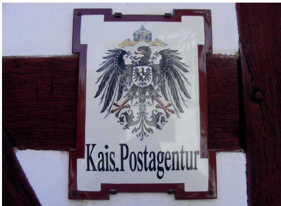
Tabliczka przed Cesarską Agenturą Poczтовую (Skansen Kommern, Niemcy, Nadrenia-Westfalia, 2016 rok)

Niniejszym artykułem rozpoczynamy cykl tekstów historycznych w „Wiciu”. Już w kolejnym numerze – pierwszy wyrski telefon i telegraf. Zachęcamy do lektury!