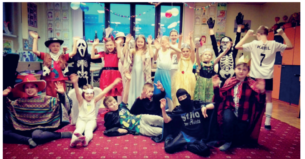
Kolorowe przebrania dzieci z „Wesołego Zakątką” w Gostyni