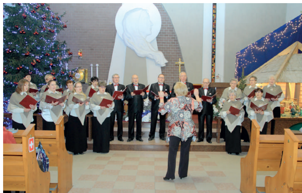
Chór „Zorza” na koncercie w kościele pw. Niepokalanego Serca NMP w Łaziskach