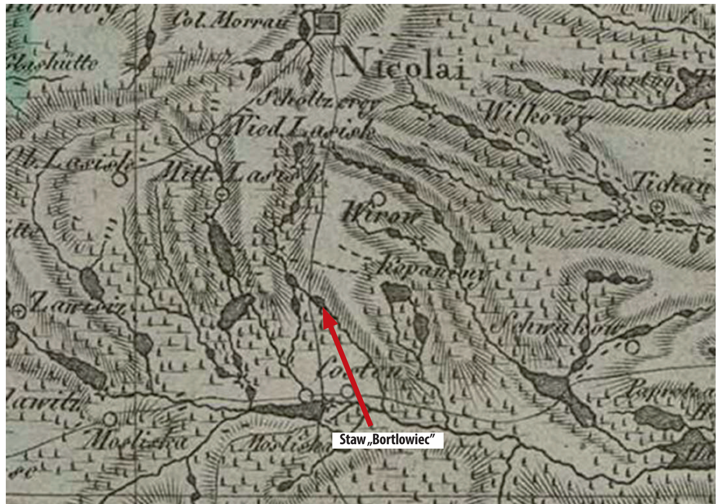
Niemiecka mapa topograficzno-wojskowa z początku XIX wieku

rozumieniu z innymi sąsiadami. To był taki jej wewnętrzny imperatyw, że każdemu w potrzebie trzeba pomóc. Słabiej przesuszoną trawę układało się w małe „kopki”, a suche siano - w duże „kopy”.