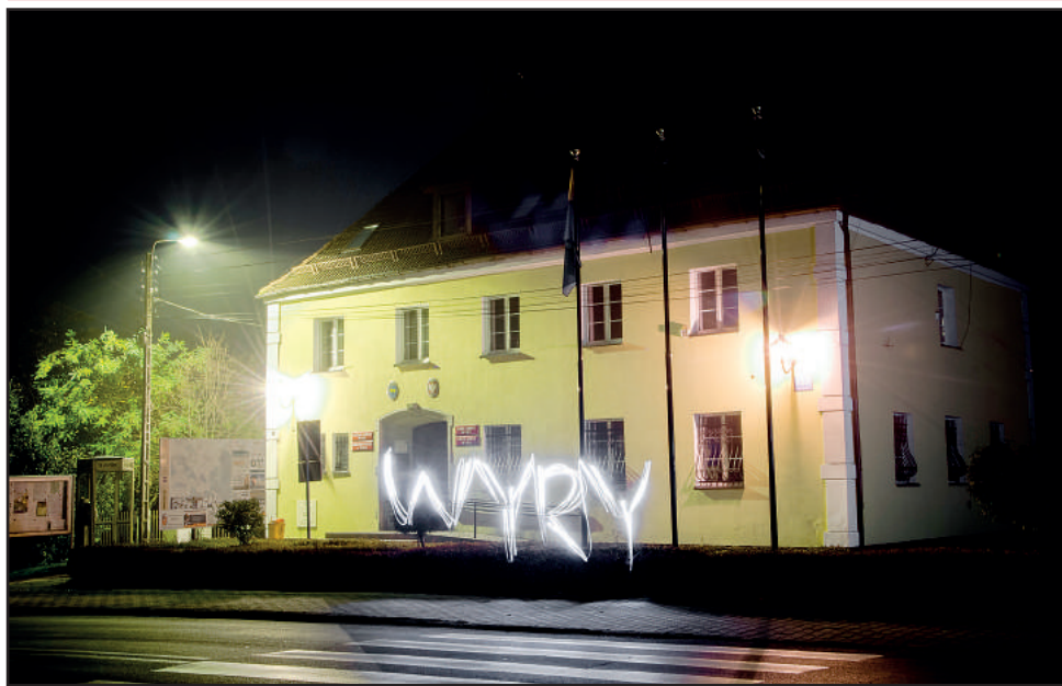
Urząd Gminy Wyry, ul. Główna 133, 43-175 Wyry Tel. (32) 325 68 00, Fax. (32) 325 68 09