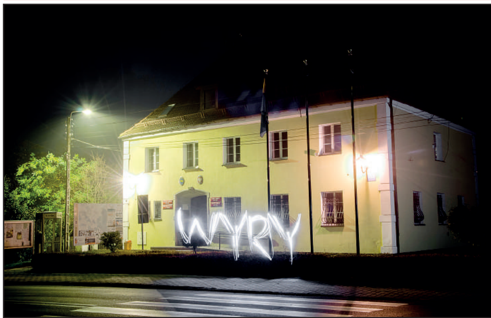
Urząd Gminy Wyry, ul. Dąbrowszczaków 133, 43-175 Wyry (od 1 września – ul. Główna) Tel. (32) 325 68 00, Fax. (32) 325 68 09