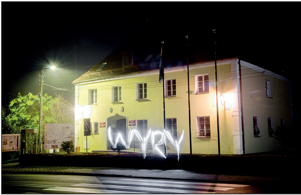
Urząd Gminy Wyry, ul. Dąbrowszczaków 133, 43-175 Wyry Tel. (32) 325 68 00, Fax. (32) 325 68 09