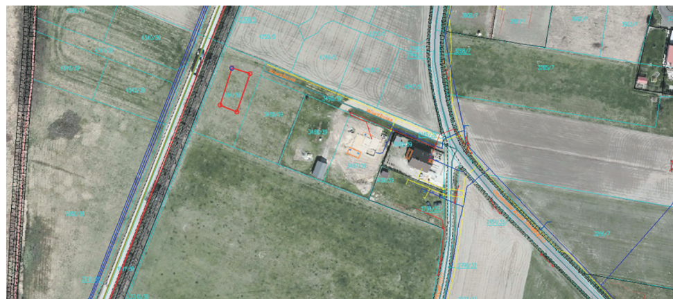
Gostyni, ul. Wierzbowa (skrzyżowanie ulic Fr. Kłosa i Obrońców Ziemi Śląskiej) - Oznaczenie kontenera: prostokąt koloru czerwonego