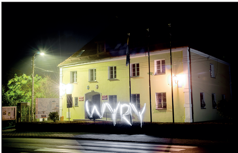
Urząd Gminy Wyry, ul. Dąbrowszczaków 133, 43-175 Wyry Tel. (32) 325 68 00, Fax. (32) 325 68 09