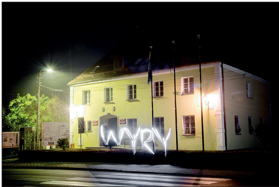
Urząd Gminy Wyry, ul. Dąbrowszczaków 133, 43-175 Wyry Tel. (32) 325 68 00, Fax. (32) 325 68 09